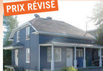
LAC-ETCHEMIN: Propriété convenant à tous les budgets, grandes pièces, 3 cc, grand patio avec vue partielle sur le lac, près des services. Le confort à prix très abordable!