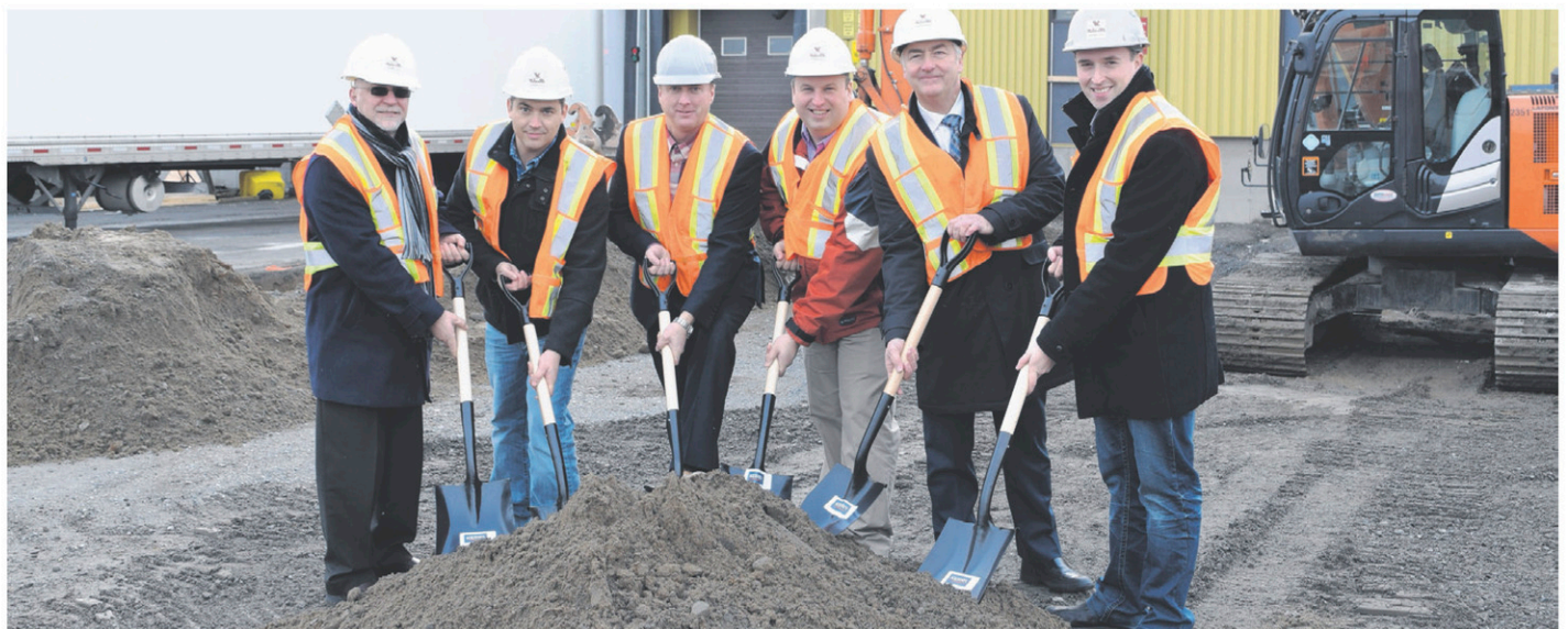
Une première pelletée de terre symbolique a souligné le début des travaux qui permettront à l'usine Kerry de rejoindre le réseau de gaz naturel mis en place au cours de l'été.

D'autres projets sont sur la table et pourraient conduire à un agrandissement des capacités de l'usine