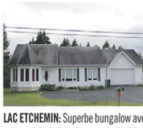
LAC ETCHEMIN: Superbe bungalow avec garage, très bel aménagement intérieur, cuisine rénovée, comptoir de granit, 4 cc, 2 sl.bains, s-sol aménagé, terrain 15 000pc avec piscine neuve. Elle a tout pour vous plaire!

Faire affaire avec la compétence, voilà toute la différence!