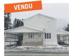
STE-JUSTINE: Duplex entièrement rénové.

Pour vendre ou acheter: www.enbeauce.com