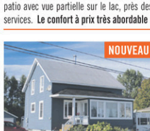
ST-CAMILLE: Jolie résidence rénovée avec soin, très fonctionnelle, 3 cc, solarium, grand patio, terrain aménagé avec goût et garage de 16 X 40. Une propriété à bas prix qui comblera vos attentes!