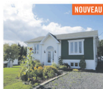
ST-LUC: Bungalow 1993, 3 cc, 2 salons, entretien impeccable, terrain de 30 576 pc avec garage de 24 X 30, très bel aménagement paysager et bien situé.