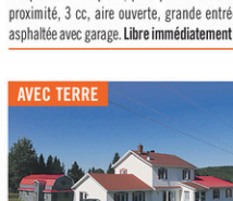
ST-CAMILLE: Résidence à bas prix demandant certaines rénovations, 4 cc, grand terrain de 90 X 214, libre rapidement. Faites votre offre!