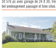
LAC ETCHEMIN: Très belle résidence dans un quartier tranquille, parc pour enfants à proximité, 3 cc, aire ouverte, grande entrée asphaltée avec garage. Libre immédiatement!