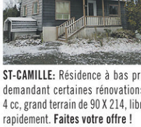
ST-CAMILLE: Résidence à bas prix demandant certaines rénovations, 4 cc, grand terrain de 90 X 214, libre rapidement. Faites votre offre!