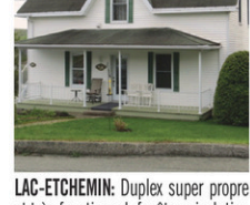
LAC-ETCHEMIN: Duplex super propre et très fonctionnel, fenêtres, isolation et revêtement ext. refaits à neuf, toujours loués, rue tranquille, très beau terrain avec vue sur le lac de la terrasse. À voir!