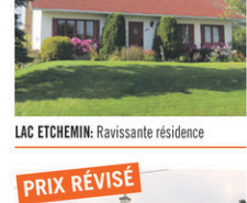
LAC ETCHEMIN: Ravissante résidence