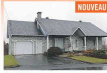
STE-JUSTINE: Superbe propriété vous offrant 5 cc, 2 sl.bains, s-sol aménagé, 2 garages intégrés, grand terrain de 30 000 pc, près des écoles, secteur convoité. Vendu au prix de l'évaluation municipale et libre rapidement!

Faire affaire avec la compétence, voilà toute la différence!