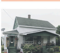
ST-ODILON: Jolie propriété dans une municipalité dynamique, 13 pces, 6 cc, rue tranquille, superbe vue panoramique sur les montagnes, 2 garages détachés. Idéal pour jeunes familles!