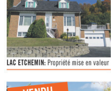
LAC ETCHEMIN: Propriété mise en valeur