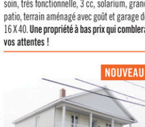
SAINTE-ROSE: Duplex de 2 X 4 1/2 pces, toujours loués, bien situé, très belle vue panoramique à l'arrière, toiture neuve, plusieurs rénovations effectuées. Un investissement à bas prix!