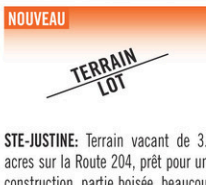
STE-JUSTINE: Terrain vacant de 3.5 acres sur la Route 204, prêt pour une construction, partie boisée, beaucoup de potentiel, zonage résidentiel. Faites votre offre!