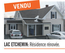
LAC ETCHEMIN: Résidence rénovée.