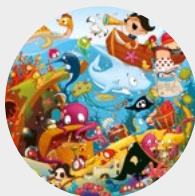
L'aventure à la mer