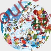
L'aventure en hiver