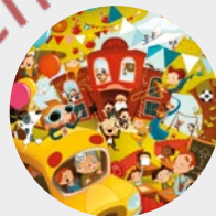
L'aventure à l'école