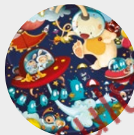
L'aventure dans l'espace