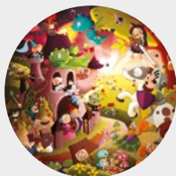
L'aventure au royaume