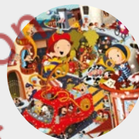
L'aventure dans la ville en folie