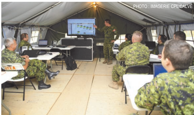
Réunion de coordination le 21 août 2018 au camp entre les membres du 2 e Escadron d'entraînement expéditionnaire aérien.

Le 2 EEEA est une unité de la 2 e Escadre composée de 32 membres regroupant pas moins de 20 métiers différents. Bien que son mandat principal soit de planifier et livrer l'entraînement collectif pré-déploiement aux membres de toutes les Forces opérationnelles aériennes canadiennes se déployant au Canada ou à l'international, le 2 EEEA est également responsable de coordonner la planification et la préparation de l'entraînement collectif et individuel interne à la 2 e Escadre.