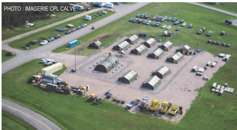
Prise de vue aérienne du camp que la 2 e Escadre a bâti à la BFC Bagotville en vue d'entraîner les membres déployant durant la rotation 7 de la FOA-I.

Cet exercice de 14 jours reproduisant le plus fidèlement possible les conditions de travail observées en théâtre opérationnel servait à la fois à compléter l'entraînement collectif des membres de la FOA-I et à confirmer leur état de pré-