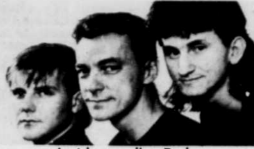
Le trio canadien Rush