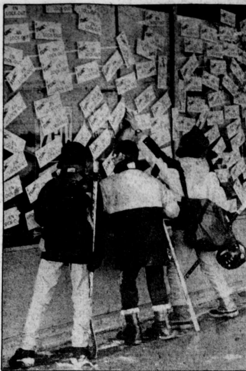
Les placards syndicaux collés dans les vitrines du Provigo Montbert, font la joie des enfants à Sainte-Foy.

Dans les six autres supermarchés Provigo de Québec, Sainte-Foy, Cap-Rouge, Lévis et La Pocatière, en grève ou en lock-out, les règlements tardent aussi à se réaliser. Des séances de conciliation se sont déroulées au cours des deux dernières semaines, mais sans succès.