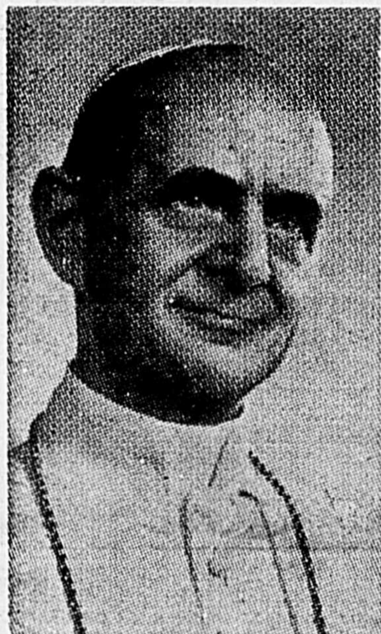
Sa Sainteté Paul VI

CITE DU VATICAN (d'après l'AFP) — "La paix est un devoir! La paix, c'est la sécurité, la paix, c'est l'ordre, nous voulons dire un ordre juste et dynamique. La paix, il faut la vouloir, la paix, il faut l'aimer, la paix, il faut la réaliser. Là où il n'y a pas de paix, le droit perd son visage humain".