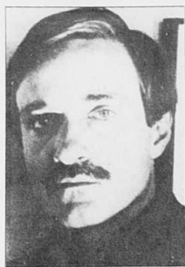
YVES NAVARRE.

Dans ce journal d'un convalescent qui, délibérément, fait table rase de tout ce qui lui importait, abandonne ce qui constituait son environnement le plus naturel, on retrouvera, de page en page, le vrai, l'incorrigible plumeur. Yves Navarre peut bien tout quitter, la littérature, elle, ne le quittera jamais. Elle l'accompagnera jusqu'à son dernier souffle. Un souffle qu'il sait désormais menacé. D'où, sans doute, cet empressement à retrouver les six premiers textes de cet ouvrage, romans achevés, nouvelles quelquefois allongées, mais qui révèlent la passion d'un vrai romancier. Dont on sait, quand on a lu Biographie (1981), qu'avant de voir son premier livre accepté par un éditeur, il en avait déjà entièrement rédigé... 18!