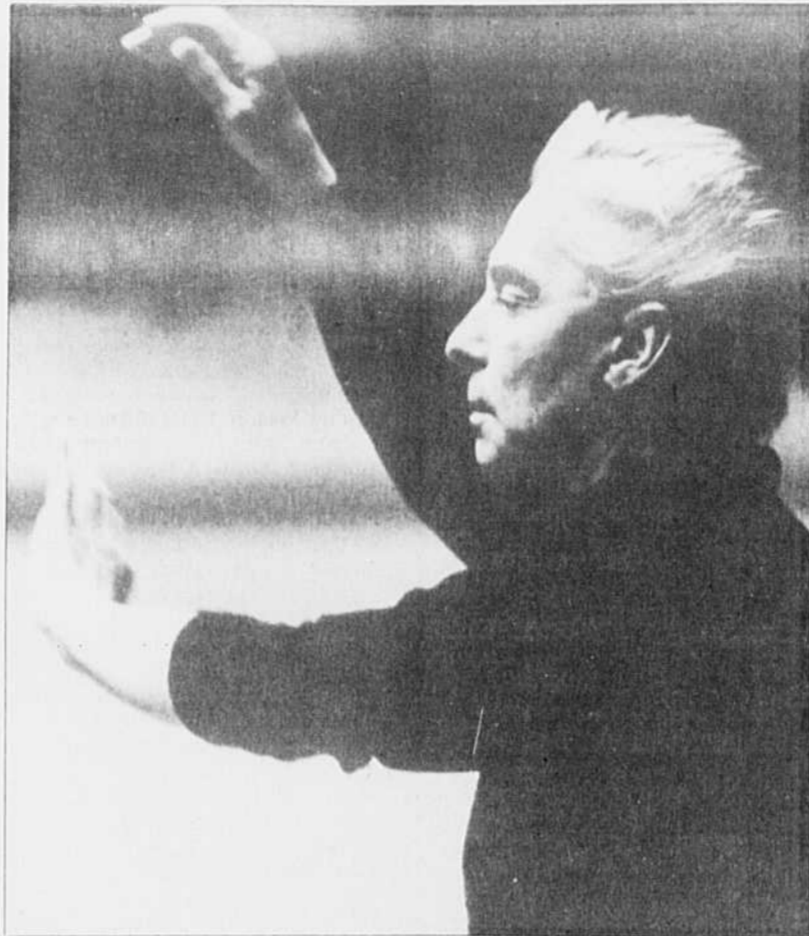
HERBERT von KARAJAN.

L'auteur consacre aussi de nombreuses pages à tenter d'éclaircir le mystère qui entoure toujours la rivalité, présumée ou réelle, qui s'est prolongée durant plusieurs années entre von Karajan et Wilhelm Furtwängler, son illustre prédécesseur à la direction de l'Orchestre philharmonique de Berlin. Il semblerait que von Karajan ait, à cette époque, acquis un prestige toujours grandissant grâce à l'appui d'un gouvernement qui souhaitait réduire le prestige de Furtwängler, ce dernier opposant souvent une forte résistance aux autorités, surtout en ce qui avait trait à la présence d'instrumentistes de race juive dans la Philharmonique de Berlin.