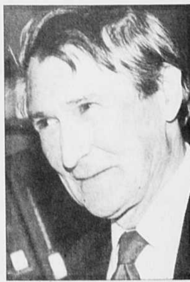
FERNAND DUMONT.

Reste le style, que certains diront opaque et trop dense, d'autres trop littéraire. Il y a, assurément, un style Dumont, qui exige probablement une assez longue fréquentation pour être apprécié à sa juste valeur. Il se situe aux antipodes du style proluxe de maints essayistes français (qu'on pense, par exemple, à l'essai récent d'Alain Finkielkraut); la concision atteint parfois le point critique. À cet égard, M. Dumont apparaît comme un écrivain typiquement québécois, dans la mesure où les Québécois ont le verbe elliptique et n'aiment guère gloser sur les présuppositions.