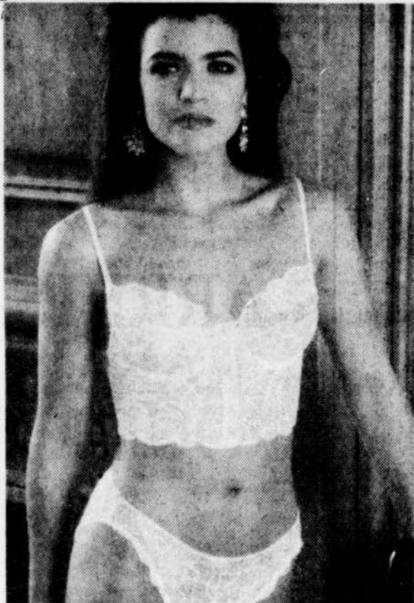
Dentelle de France...

2646, CHEMIN STE-FOY, STE-FOY, QUÉ. G1V 1V2 (418) 656-1902