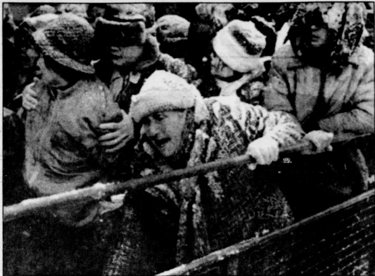
Cette bousculade a été provoquée une fois de plus, hier, par les magasins Honest Ed's de Toronto qui distribuaient 700 dindons gratuits. Sur notre photo, une dame âgée est bousculée à l'ouverture du magasin où en pleine tempête de neige des centaines de personnes ont fait la queue durant des périodes allant jusqu'à cinq heures.