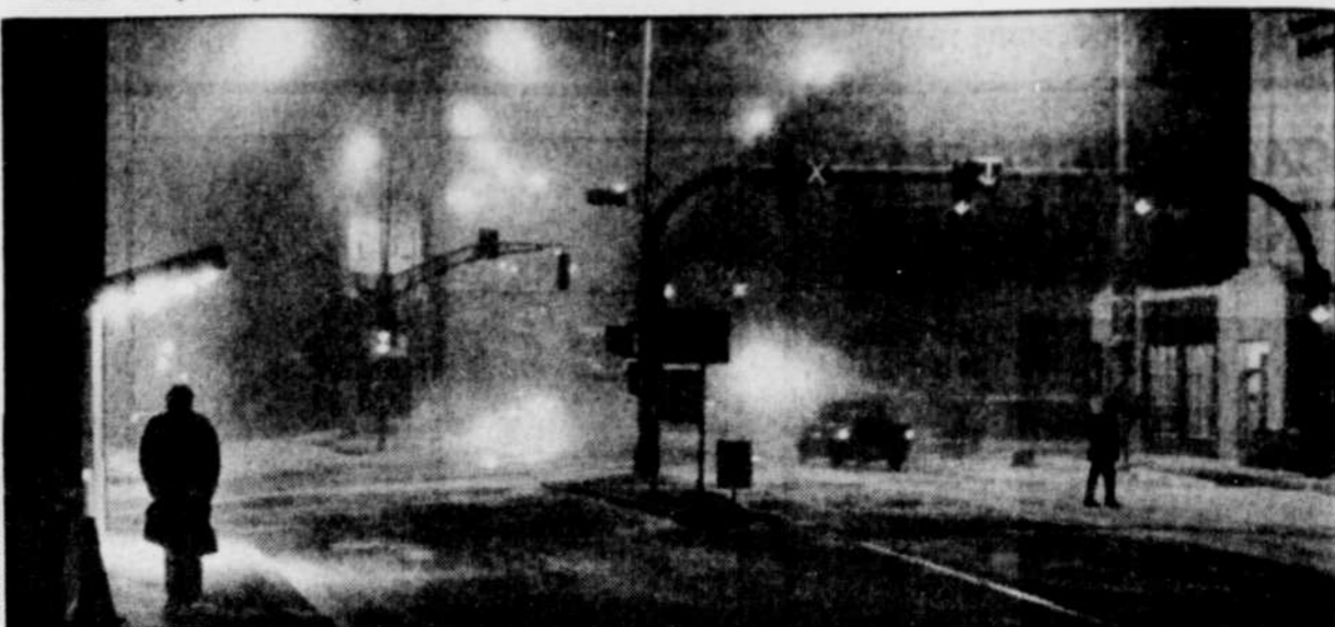
Dès le milieu de la soirée, la neige poussée par de forts vents atteignait le centre de la ville de Québec.

gues s'aventuraient même à prédire des chutes occasionnelles de neige pour jeudi et vendredi.