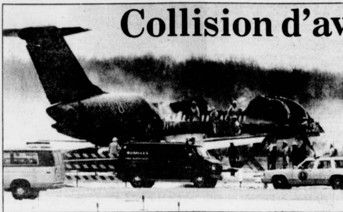
Des secouristes fouillent les débris fumants du DC-9 de la Northwest Airlines sur la piste de l'aéroport métropolitain de Detroit.

Neige et poudrière en matinée. Neige mêlée de grésil en après-midi. Accumulation de 15 à 25 cm. Maximum: 0 à -2; minimum: près de -4. Vents du nord-est de 30 à 60 km/h. Demain: nuageux avec neige. S-16