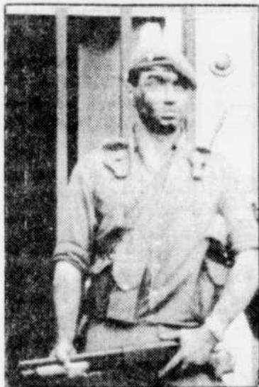
Un officier rebelle monte la garde devant le quartier général de l'armée argentine.

Au moins 13 personnes ont été tuées. Selon des sources officielles, le bilan serait aussi de 200 blessés et de 350 personnes arrêtées parmi les militaires mais aussi des civils. Et ce à 48 heures de l'arrivée à Buenos Aires du président George Bush des États-Unis.