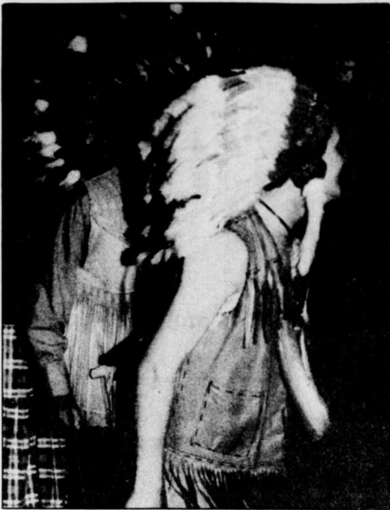
Les Montagnais fêtent le Mukusham

En fait, nous nous interrogeons sur le «type de drapeau» que l'État canadien, voire le Québec, entend porter dans l'ordre juridique international. Pour nous, l'État ne devrait avoir de réalité que par les peuples dont il exprime les besoins et les droits. C'est là une condition essentielle à