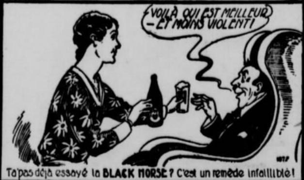
T'as déjà essayé la BLACK HORSE? C'est un remède infallible!