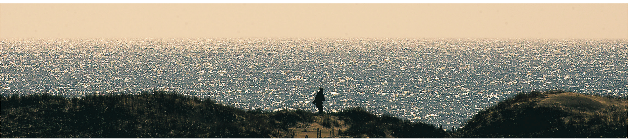
Promeneuse solitaire sur la Plage de l'ouest, aux îles de la Madeleine.