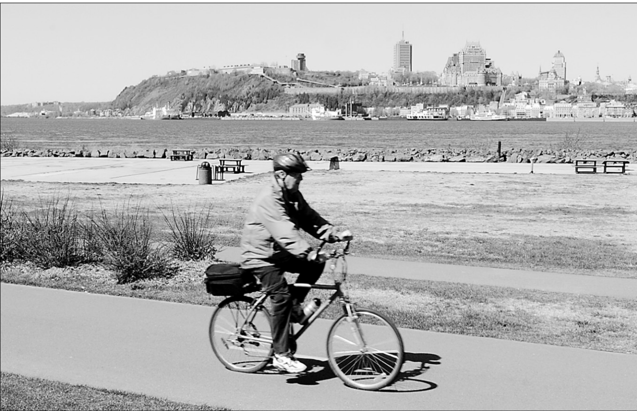
Grâce à cette nouvelle piste cyclable panoramique, plus de cyclistes de Québec font maintenant le voyage jusqu'à Lévis.

Et tant mieux si les gens de Québec et les touristes doivent se déplacer pour croquer dans le parfait mélange de chocolat noir et de crème glacée à la vanille. «Découvrir Lévis, c'est découvrir une destination avant son temps», conclut Christine Beaulieu.