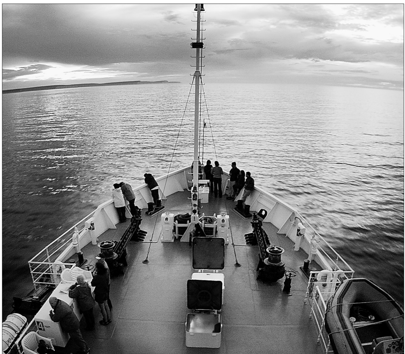
Coucher de soleil vue du bateau de croisière L'Écho des Mers, au large de l'île d'Anticosti.