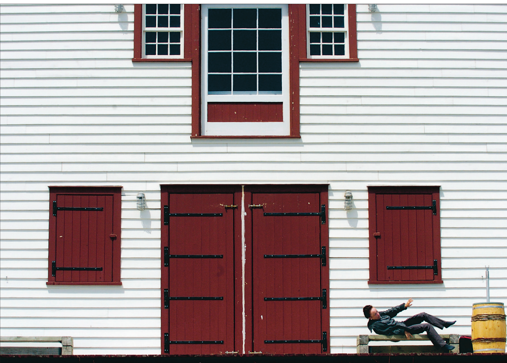
Fin de la sieste près de la plage bordant le fameux rocher Percé.

TEXTES D'ARIANE KROL