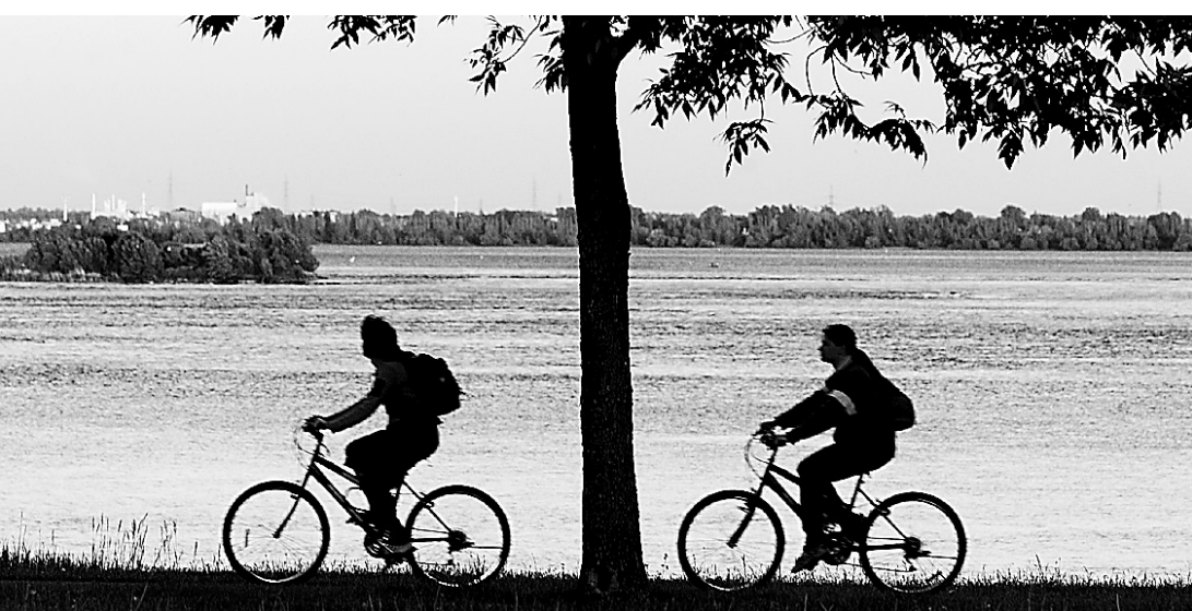
C'est aussi ça... Verdun. Le boulevard LaSalle est à deux pas de la piste cyclable.