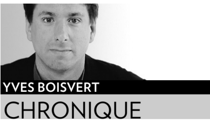
YVES BOISVERT CHRONIQUE

J'avais bien remarqué la fissure dans la voix, sa façon de tout brûler en écrivant. Je pensais qu'il avait un poignard entre les dents. Il avait un couteau planté dans la gorge.