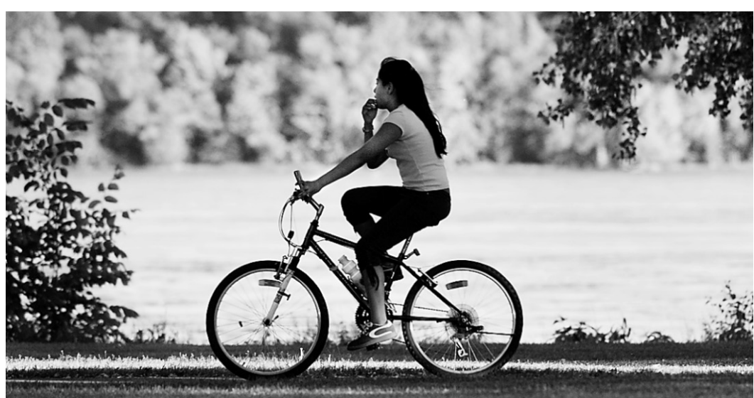
Un peu plus à l'ouest, une jeune cycliste se balade à LaSalle.