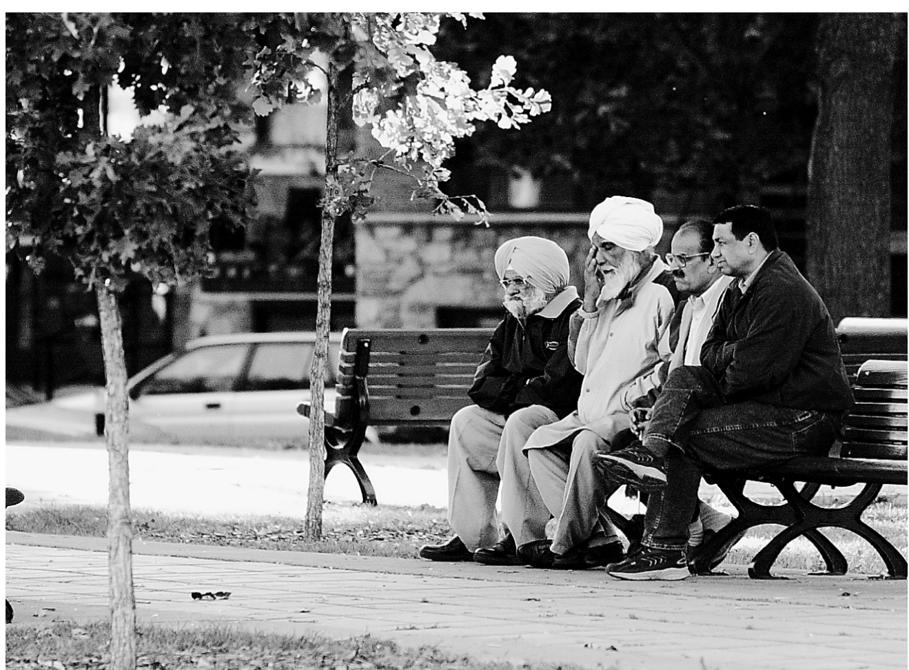
Pause détente au parc Athéna, dans Parc-Extension.