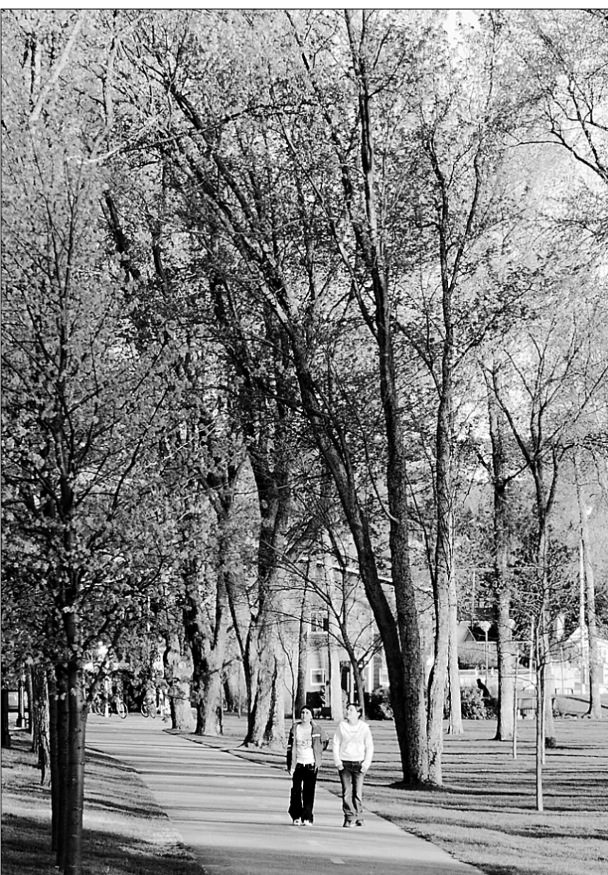
Promenade dans un parc à Lac-Mégantic.

Lac-Mégantic, petite municipalité nichée dans l'extrême est des Cantons-de-l'Est, possède un nombre impressionnant de commerces de détail et frôle le plein emploi. « Quand on est loin de tout, on apprend à se débrouiller. On se prend en main. »