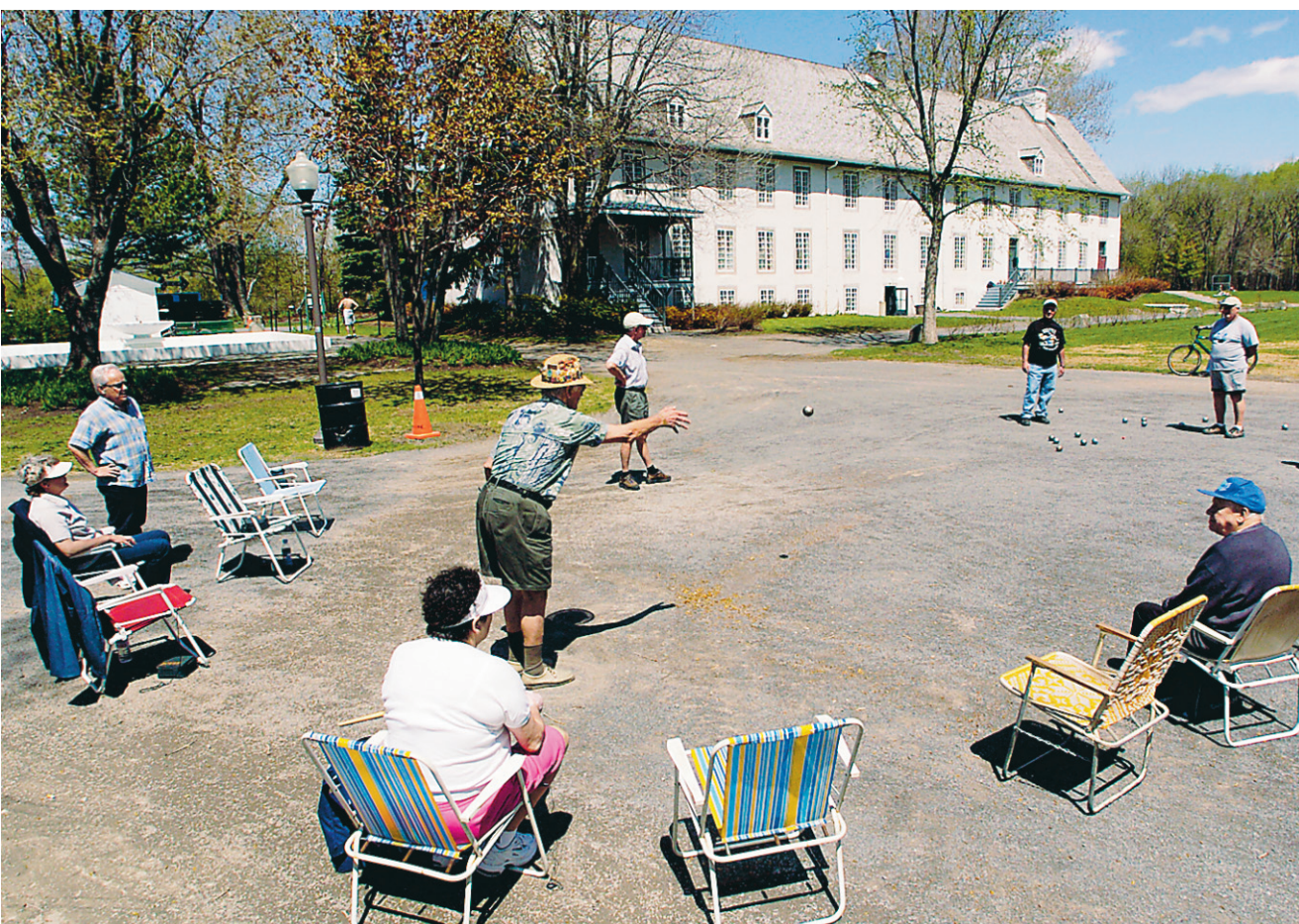
Partie de pétanque au domaine de Maizerets, à Québec.