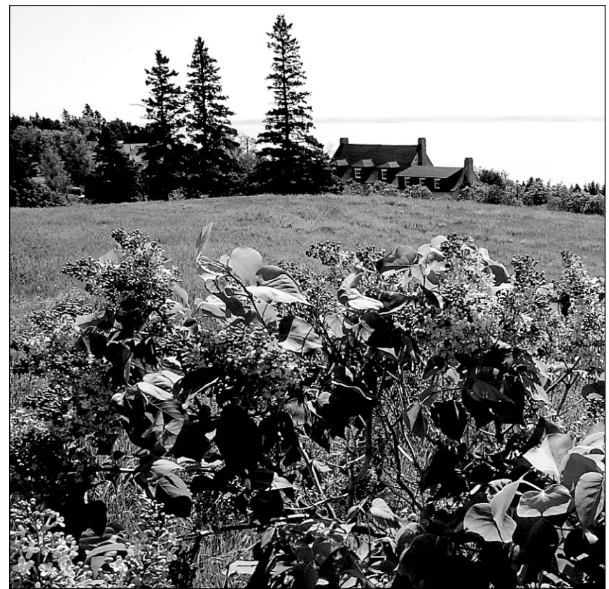
Lilas en fleurs à Cap-à-l'Aigle, dans Charlevoix.

Mon Québec de lumière est fait aussi d'orages « électriques », fièrement présentés à un ami venu d'Irlande et qui n'en avait jamais vus : planté sur la terrasse d'un bar de la rue Crescent, il avait regardé le ciel se déchirer et se strier d'éclairs et j'avais eu l'impression de retrouver, à travers lui, leur beauté sauvage. Trois ans plus tard, c'était moi qui avait le nez en l'air et le souffle coupé, en voyant mes premières aurores boréales, miracles mouvants et roses aperçus