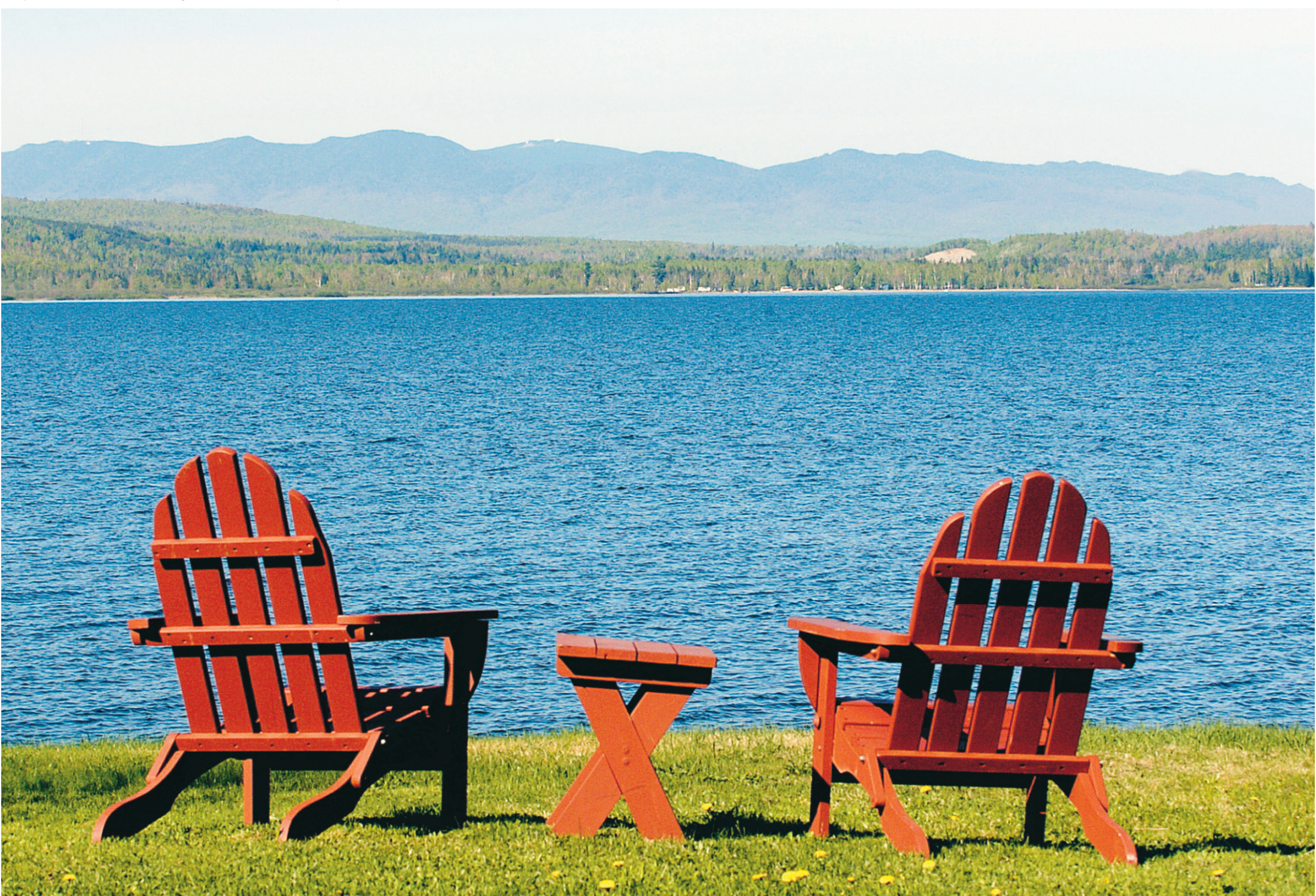
Vue sur le lac Mégantic, à l'Auberge des Victorines.

Le quiz du Québec a été réalisé grâce à la collaboration des quotidiens du réseau Gesca : Le Soleil, Le Quotidien, Le Droit, La Tribune, La Voix de l'Est, Le Nouvelliste et La Presse .