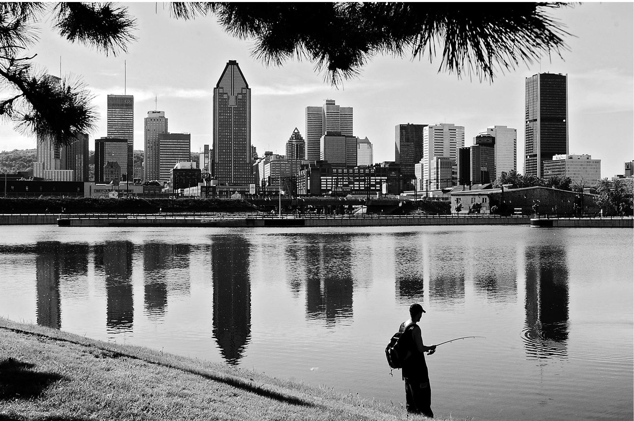
Pour les pédaleurs de fort calibre comme pour les promeneurs du dimanche, Montréal recèle des trésors naturels qui nous changent du béton et de la frénésie des festivals.