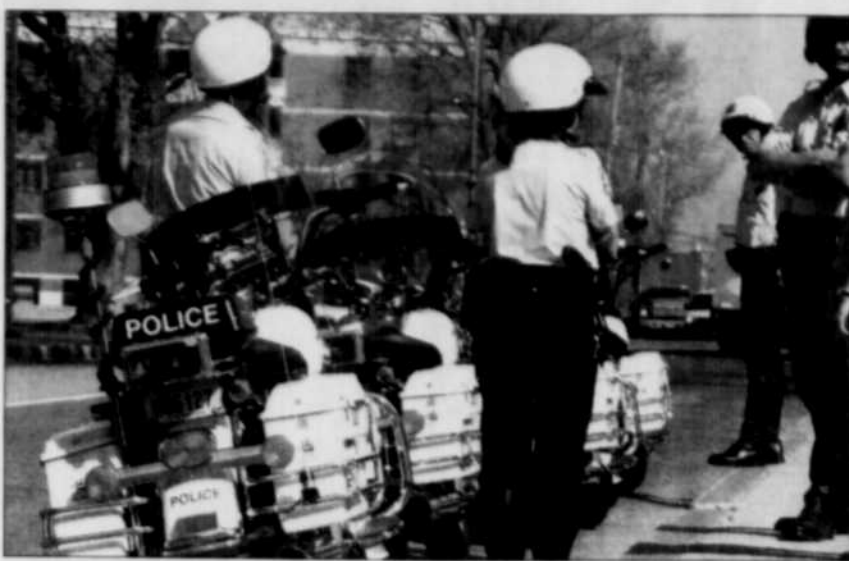
En 2001, on comptait 8300 policières au Canada, soit 8 % de plus qu'en 2000.