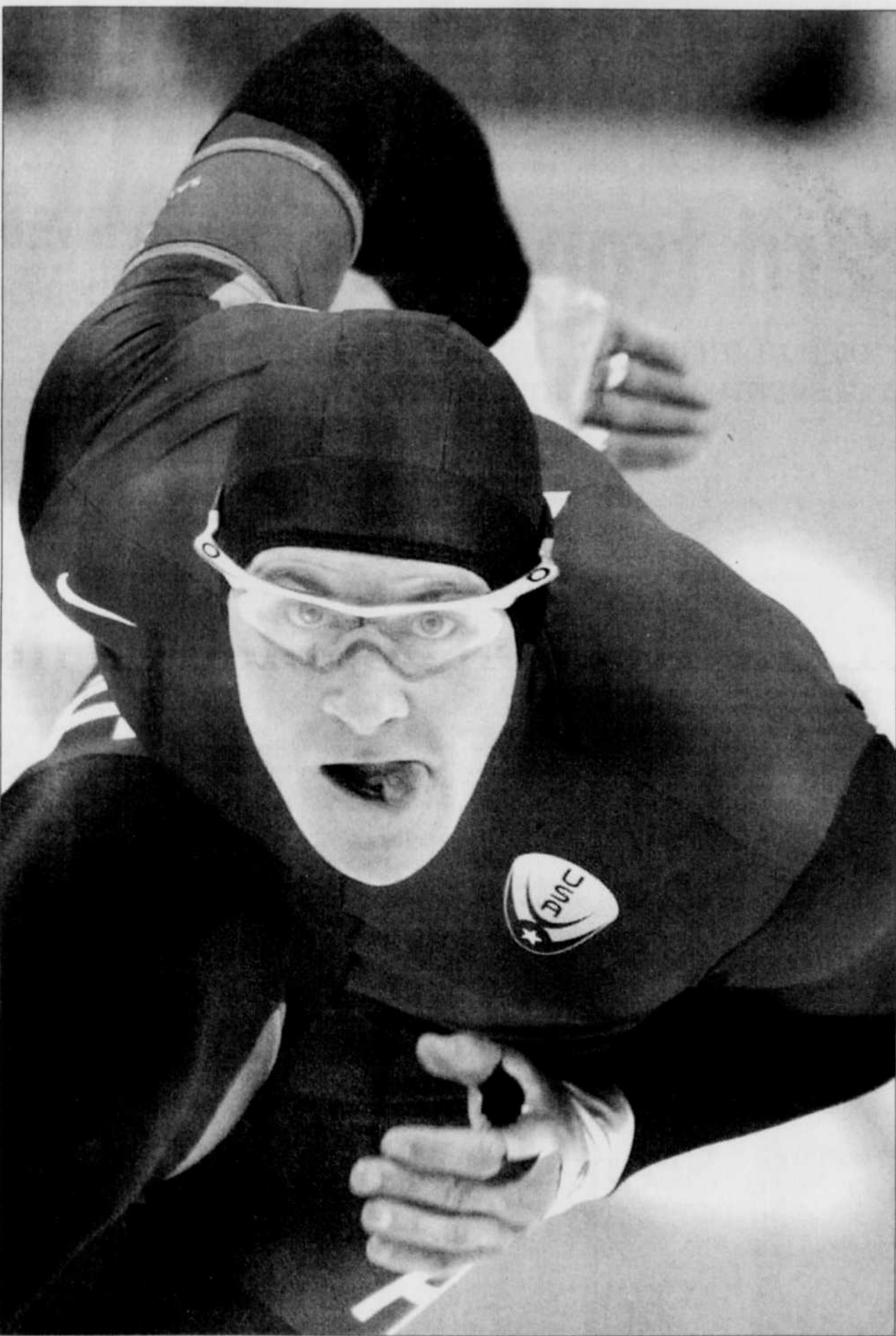
L'Américain Casey Fitzrandolph n'a pas ménagé les efforts pour remporter l'or au 500 mètres de patinage de vitesse.

« Les deux Américains ont bien fait cela. Ils étaient gonflés à bloc. Celui qui m'a vraiment étonné, c'est Carpenter. Il est devenu un professionnel dans l'art de faire la courbe des lames de l'équipe américaine. Nous sommes assez bons là-dedans aussi, mais lui, il est brillant dans ce rôle important », ajoutait Tremblay, qui est basé au centre national de l'Est du pays, à l'Anneau de glace Gaétan Boucher.