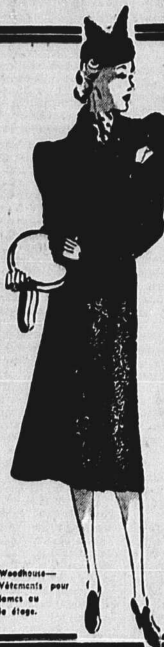
Woodhouse—Vêtements pour dames—Au 4e étage.

La première mensualité assure la livraison. 40 versements hebdomadaires de 50c ou 10 mensualités de $2.00 PAS D'INTERET — PAS DE SUPPLEMENT.