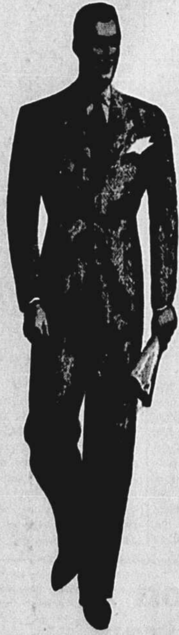
Woodhouse—Vêtements pour hommes—Au 4e étage.

En vente! COMPLETS 2 PANTALONS POUR HOMMES