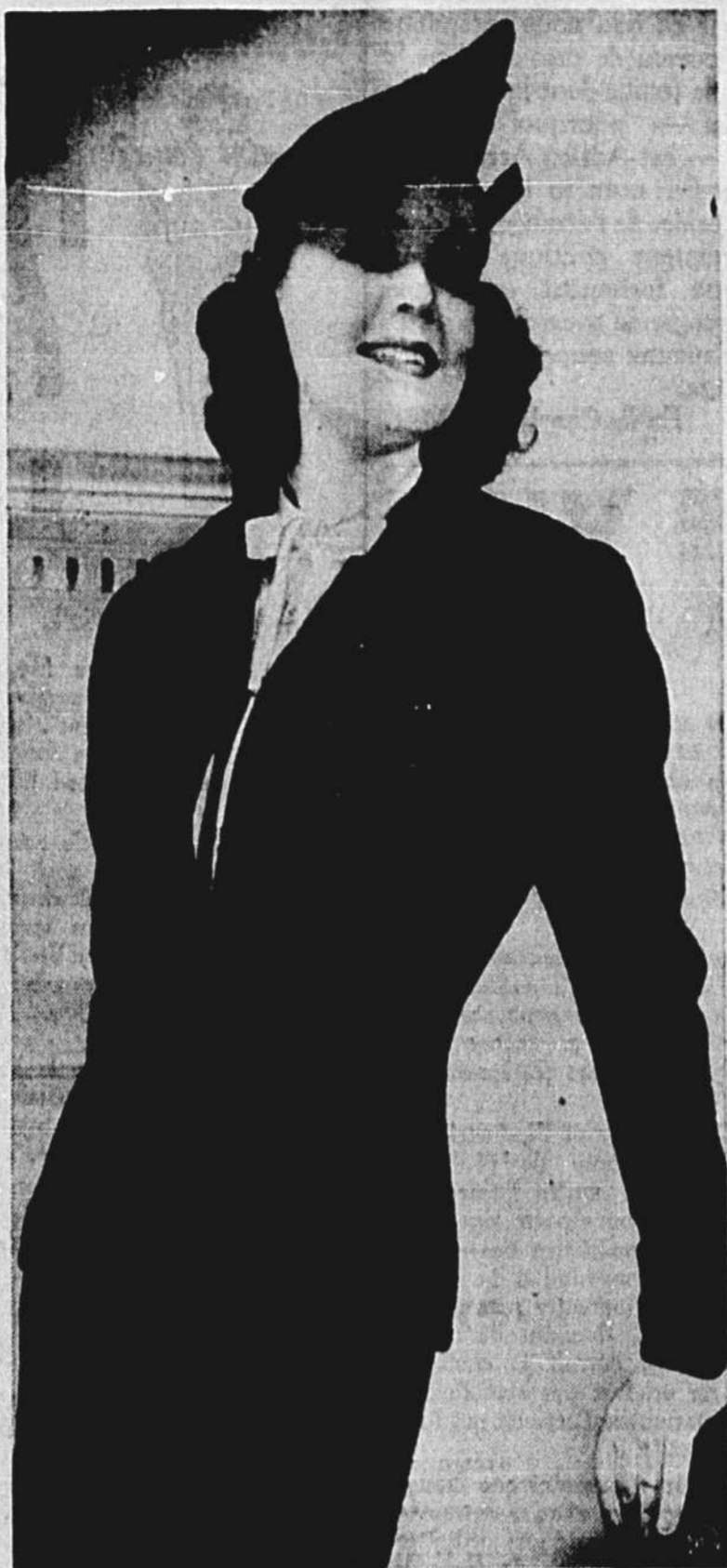
Délicieux costume-tailleur de laine noire, bordé de galon brillant, et garni de boutons recouverts du même galon — une nouveauté. Très chic avec une petite blouse blanche.