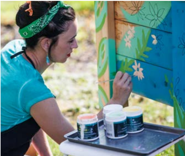
Le jardin a été embelli par l'artiste Geneviève Phénix

Cette initiative découle de la politique de développement durable de la municipalité, Empreinte d'avenir.