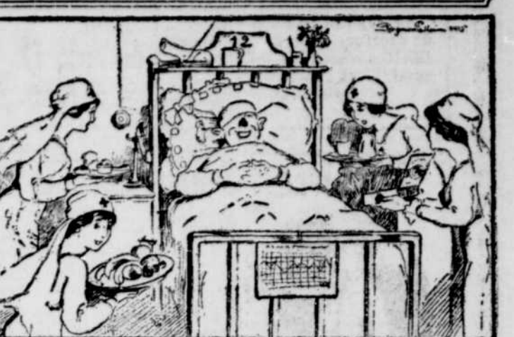
—C'est ça, les horreurs de la guerre?..... (La Balonnette)