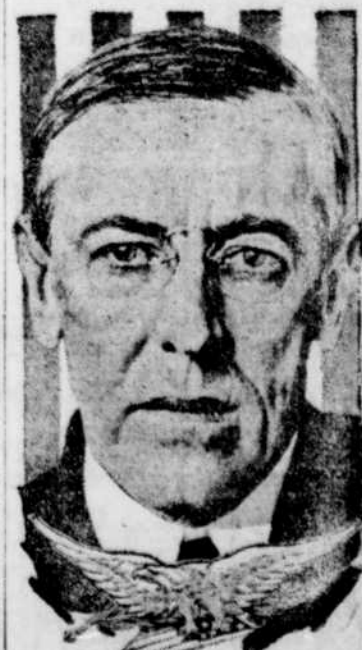
M. WOODROW WILSON qui a répondu par un refus à la note du pape. Autrement, les Alliés ne sauraient être justifiés d'accepter de telles conditions. Voici le texte de la réponse: 17 août 1917. A Sa Sainteté Benoît XV, Pape. En accusant réception de la communication de Votre Sainteté, aux peuples. A suivre sur la page 11

"La paix permanente doit être basée sur la foi de tous les peuples et sur la justice et les droits communs de l'humanité", ajoute M. Wilson, "et nous ne pouvons prendre la simple parole des gouvernants de l'Allemagne comme garantie de ce qui pourrait se produire à l'avenir. Il faut que les déclarations des gouvernants soient appuyées par la volonté du peuple lui-même, ce qui a été fait par les autres peuples."