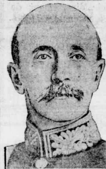
LORD GREY, ancien gouverneur-général du Canada, (1904-1911) qui est décédé ce matin, à Howick, en Angleterre.