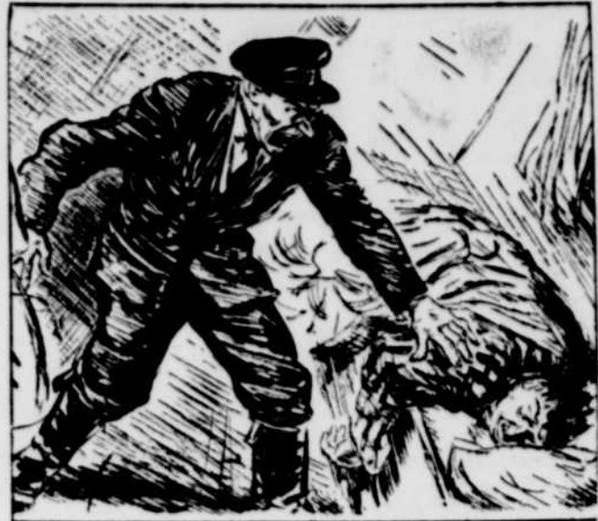
—Le signal d'alarme, monsieur, nous sommes! —Le ciel soit béni! Je croyais que c'était la perforance du bateau!