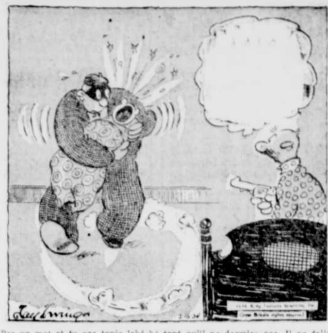
Pas un mot et tu vas tenir le bec à tant qu'il ne dormira pas. Il ne fallait pas l'éveiller!

Shanghai, Chine, 8. (P.C.) — Une nouvelle de Canton dit que 90 personnes, hommes et femmes, ont perdu la vie lors du naufrage du navire «Chien Sien», qui s'échoua sur un rocher dans la rivière aux Perles et sombra à mi-chemin entre Hong Kong et Canton, 400 personnes au moins, étaient à bord du vaisseau. Nombre d'entre elles ne purent sortir de leurs cabines.