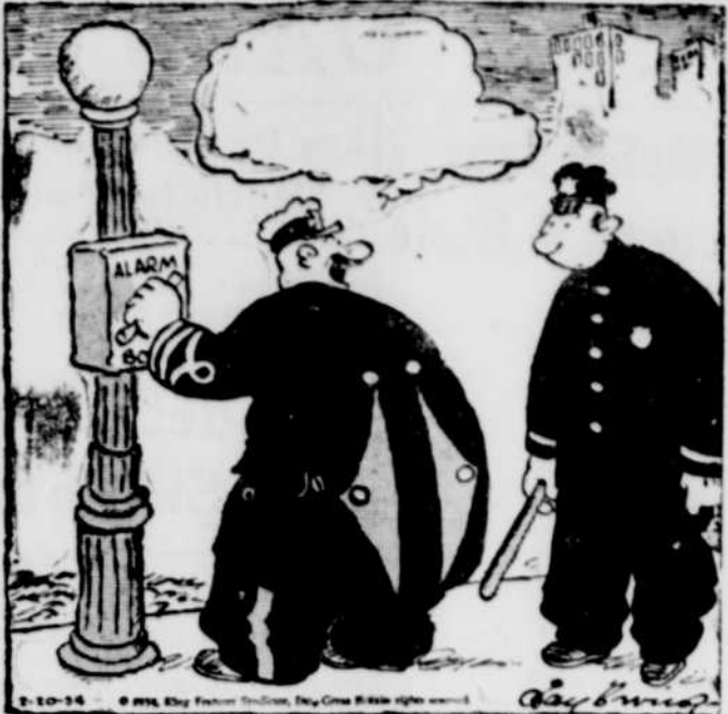
—Je voulais simplement jouer un petit tour aux amis du poste des pompiers.