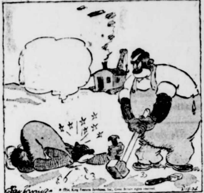
Ca n'empêche pas que tu me dois un autre 10 cents pour avoir de nouveau manqué ton coup.