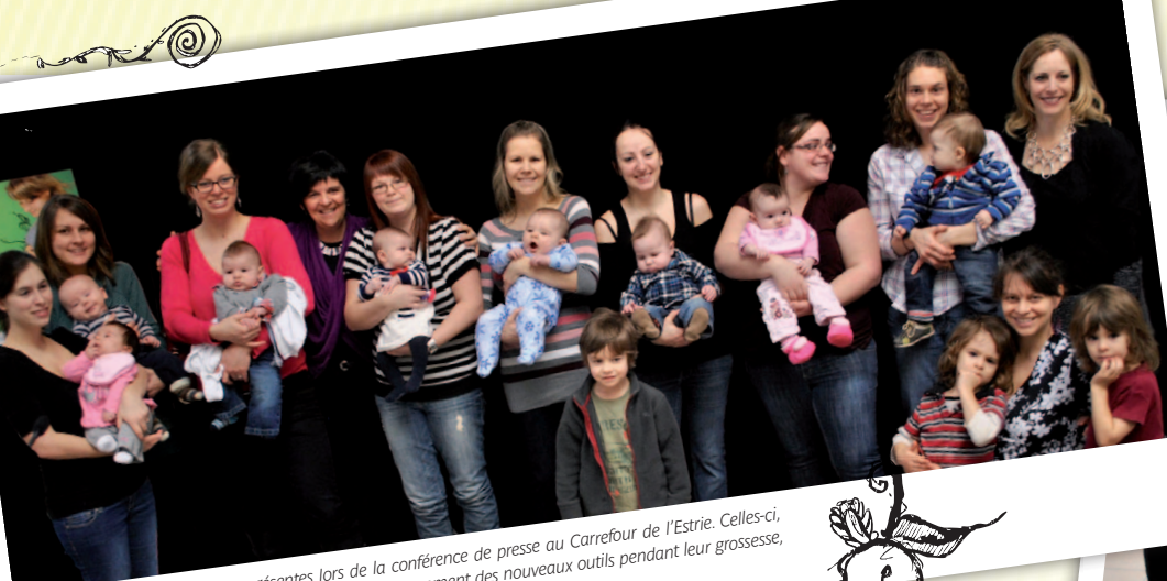
Plusieurs mamans étaient présentes lors de la conférence de presse au Carrefour de l'Estrie. Celles-ci, ayant participé aux séances photo pour le développement des nouveaux outils pendant leur grossesse, étaient accompagnées de leur bébé, nouvellement arrivé dans la famille!