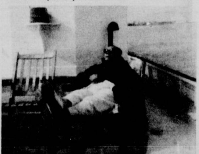
La photo la plus intime jamais publiée de TINO ROSSI est sans doute celle prise sur le bateau de PAOLO NOEL, il y a quelques années.