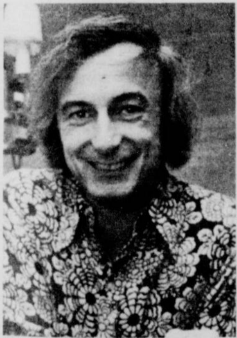
YVON DESCHAMPS ...Paris?

Mireille Darc, quelques jours après la première de son film "Laisse aller, c'est une valse" a repris l'avion pour se rendre à New-York où elle allait parler d'affaires avec le directeur d'une importante maison de production américaine qui lui a proposé la vedette d'un film. Elle reviendra à Montréal pour quelques heures, en transit pour Paris. La blonde actrice française a beaucoup plu à la presse montréalaise par sa spontanéité, sa franchise. A un journaliste qui lui demandait comment elle arrivait à vivre avec un homme comme Alain Delon elle a répondu sans lésiner: "Je sais que c'est un monstre, qu'il n'est pas facile à vivre, mais je préfère son mauvais caractère à la monotonie des autres hommes". Elle épousera éventuellement le bel acteur français quand elle voudra un enfant. Pas avant!