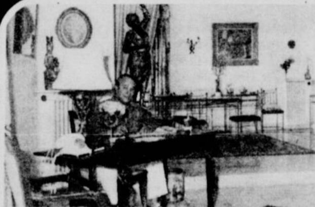
TINO ROSSI chez lui s'accorde quelques heures par jour pour s'occuper exclusivement de ses affaires. En dehors de sa carrière sa vie est entièrement consacrée à sa famille.