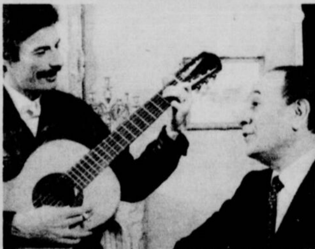
Dans une chanson "l'Idole à papa" JEAN FERRAT a imité TINO ROSSI. Une certaine presse y a vu du poivre et du feu alors que Rossi s'est amusé et que l'interprète de "Ma France" entretenait à l'égard de "l'Idole à papa" une grande admiration.