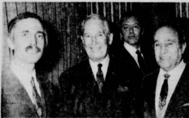
Paris en 1968, réunissait trois lauréats de l'Académie Charles Gros: PAUL MAURIAT, le regretté MAURICE CHEVALIER et TINO ROSSI.