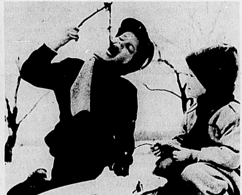
L'acériculture occupe une place importante dans notre économie rurale. Selon le ministère de l'Agriculture et de la Colonisation, la valeur des produits de l'érable au Québec atteint $12 millions. C'est une des productions les plus payantes de la ferme. Les "fêtes aux sucres", aussi populaires que les vendanges européennes, ont un attrait particulier qu'apprécie le touriste, ce dont bénéficie tout le Québec. C'est que le sirop et le sucre d'érable sont typiquement québécois ; plus de 90 pour 100 du sirop et du sucre d'érable fabriqués au Canada le sont au Québec. Ces produits alimentaires se consomment tels quels ou servent à la préparation d'un nombre considérable de mets délicieux dont la cuisine québécoise peut à juste titre se glorifier.