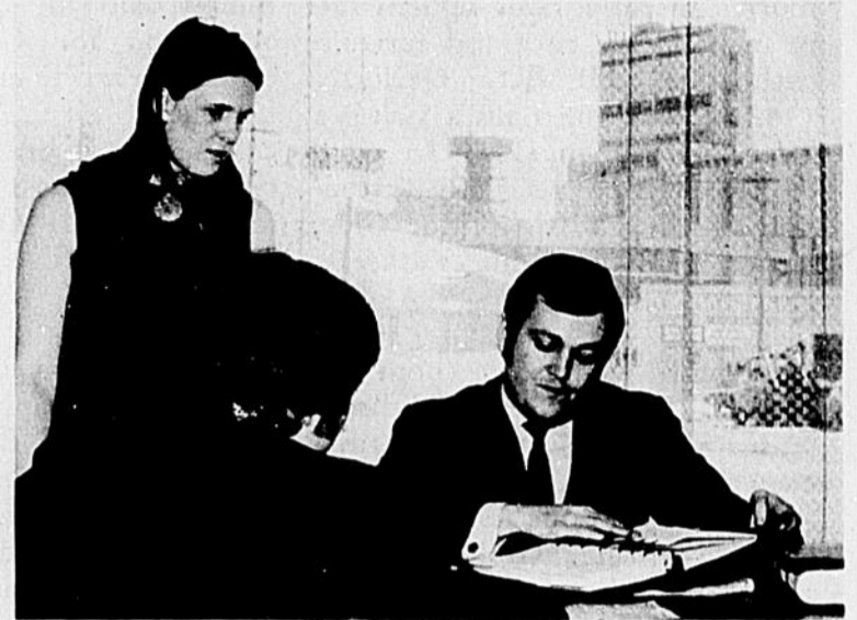
Un spécialiste des questions des impôts du Québec est à la disposition des contribuables de la région au Centre de renseignements du Québec, 2590, boul. Royal, Trois-Rivières. Au Téléphone, on peut communiquer au numéro 379-2636. Le bureau est ouvert aux heures normales et jusqu'à sept heures du lundi au vendredi.