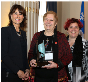
La ministre Kathleen Weil en compagnie des responsables du projet lauréat.

Cette catégorie récompense les projets qui favorisent la socialisation non stéréotypée des jeunes et promeuvent l'égalité entre les femmes et les hommes dans les milieux de l'éducation, du sport, des entreprises culturelles et des médias. Elle vise également à souligner les initiatives qui mettent de l'avant l'égalité des sexes dans un contexte de diversité croissante sur les plans culturel et religieux.