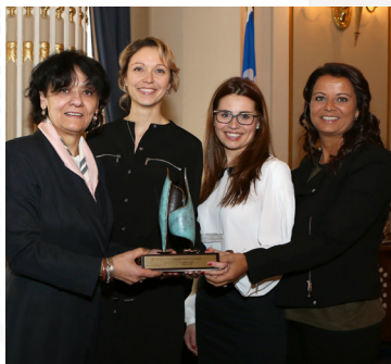
La ministre Rita L.C. de Santis en compagnie des responsables du projet lauréat.

Cette catégorie permet d'encourager les projets relatifs à la diversification des choix de formation des femmes et des hommes, à l'intégration et au maintien en emploi des femmes, à la mise en œuvre et au respect de la Loi sur l'équité salariale et au développement de l'entrepreneuriat féminin. L'amélioration de la sécurité économique des femmes tout au long du parcours de vie est aussi un objectif de cette catégorie.