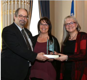
Le ministre Geoffrey Kelley en compagnie des responsables du projet lauréat.

Les projets récompensés dans cette catégorie touchent la prévention de la violence conjugale et des agressions sexuelles ainsi que la lutte contre ces formes de violence. La prévention de l'exploitation sexuelle et de la traite des femmes est aussi un objectif dans cette catégorie.