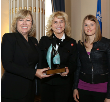
La ministre Francine Charbonneau en compagnie des responsables du projet lauréat.

Cette catégorie souligne les initiatives qui ont favorisé l'adaptation des soins de santé et des services sociaux aux besoins particuliers des femmes ou de certains groupes ainsi que la prévention en matière de santé des femmes.