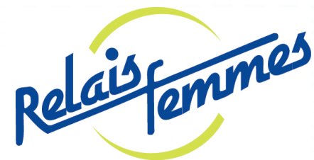
Table régionale des centres de femmes de la Montérégie, et avec Hélène Belleau, professeure à l'Institut national de la recherche scientifique.

le rapport amoureux et le droit, les codes amoureux et le rapport à l'argent, la gestion de l'argent au sein des couples, les choix et les pistes d'action individuelles et collectives. Ce projet a été réalisé en collaboration avec le Comité contre l'appauvrissement et la pauvreté des femmes de la