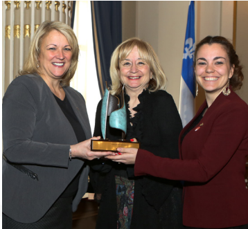
La ministre Lise Thériault en compagnie des responsables du projet lauréat.

La parité de représentation dans les lieux de pouvoir ainsi que la promotion de l'égalité entre les femmes et les hommes dans la gouvernance locale et régionale sont les principaux objectifs des initiatives récompensées dans cette catégorie.