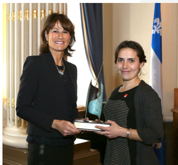
La ministre Kathleen Weil en compagnie des responsables du projet lauréat.

Les projets récompensés dans cette catégorie sont ceux touchant la répartition équitable des responsabilités familiales ou l'instauration de mesures de conciliation travail-famille faisant la promotion de l'égalité entre les femmes et les hommes dans les milieux de travail ou dans les milieux de vie.