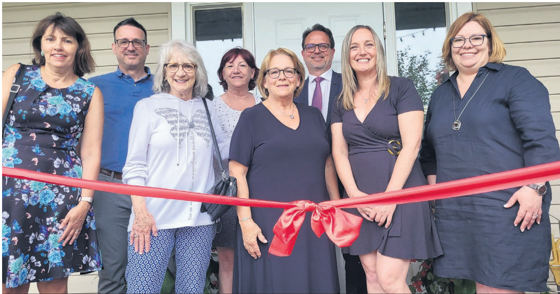
Plusieurs personnes étaient présentes pour l'inauguration de la nouvelle maison qui accueille ses résidents depuis le 14 juin dernier.