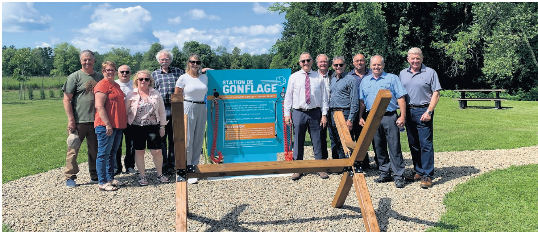
L'inauguration de la halte sportive et plein air.