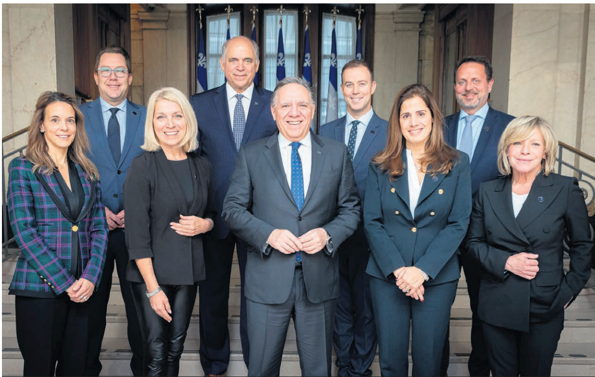
Le caucus des députés de Lanaudière.

En éducation, la ministre de l'Enseignement supérieur et députée de Repentigny Pascale Déry a posé plusieurs gestes pour assurer une bonification de l'offre universitaire. Elle a, entre autres, accordé un financement de 550 000 $ à l'Université du Québec à Trois-Rivières