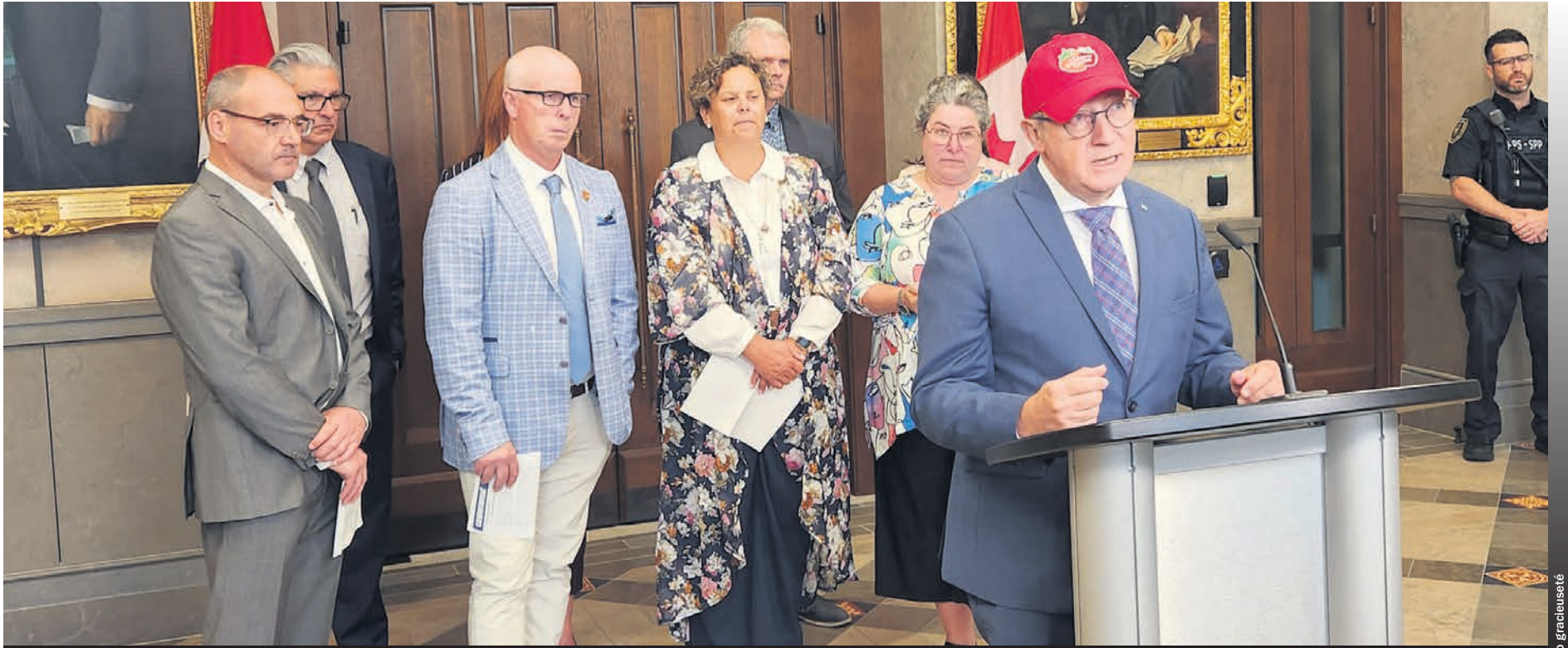
Le député de Berthier-Maskinongé, Yves Perron.