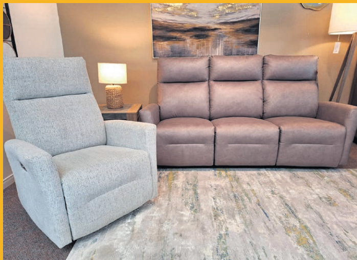
ENS. 2 MCX SOFA MOTORISÉ & FAUTEUIL BERÇANT AVEC INCLINAISON MOTORISÉE 2 CHOIX DE TISSUS. QUANTITÉS LIMITÉES