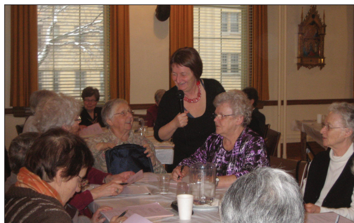
Montréal, 23 février 2013

Une écoute attentive, prodiguée à la victime, lui donne un espoir de franchir les étapes pour reprendre son équilibre. Se lier à des associations dont l'objectif vise la solidarité pour atteindre l'égalité, développer la confiance en soi et promouvoir la responsabilité pour reprendre son autonomie. C'est la mission des maisons d'hébergement d'aider à prendre conscience