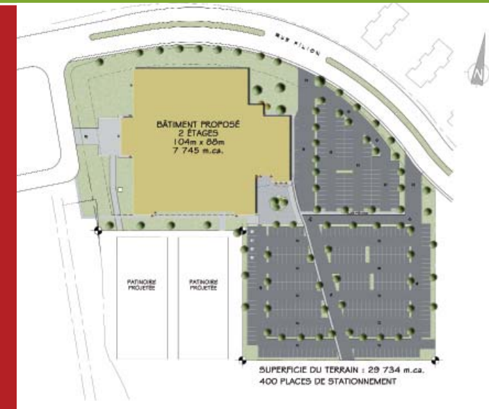
Implantation projetée du complexe sportif qui sera localisé au bout de la rue Filion, adjacent au nouveau terrain synthétique de la ville pour le soccer et le football.