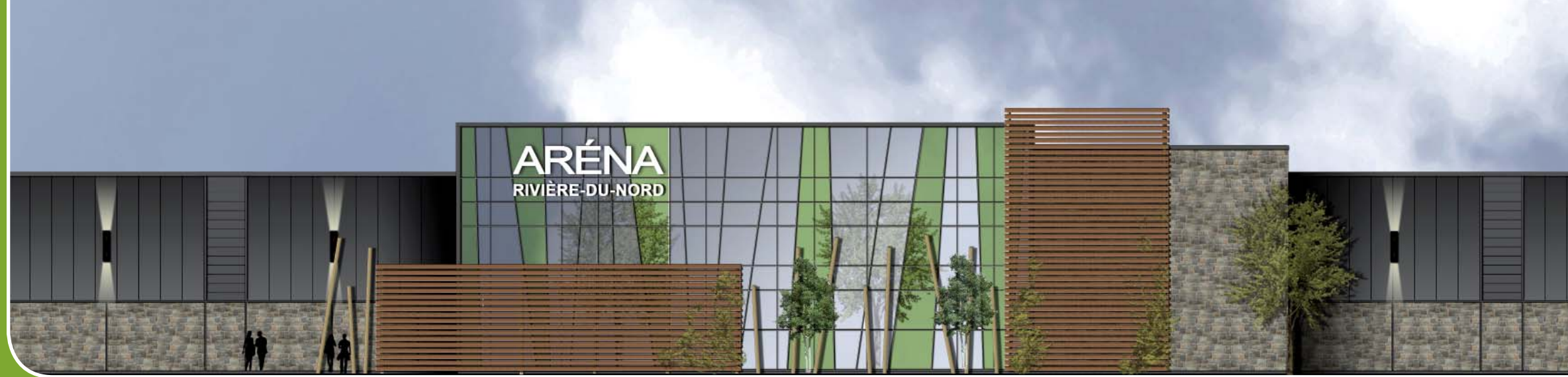
Vue au niveau de la rue du bâtiment.

Les maires étaient fiers de présenter les esquisses intérieures et extérieures de ce futur complexe qui desservira les besoins actuels et futurs des résidents des trois municipalités et des partenaires impliqués.