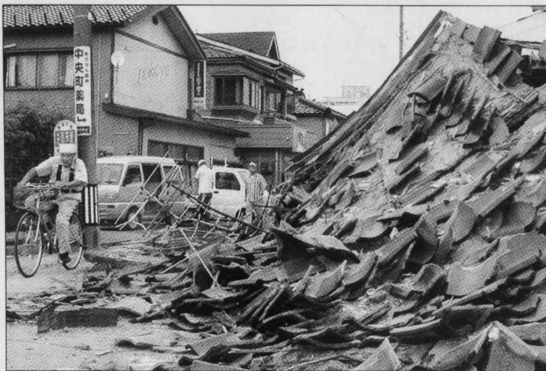
SATOSHI OYAMA REUTERS

UN DES PLUS VIOLENTS SÉISMES des dernières années au Japon, de magnitude 6,8 sur l'échelle ouverte de Richter, a frappé hier la région de Niigata (centre), faisant au moins sept morts, un millier de blessés et d'importants dégâts matériels. Il a provoqué un incendie dans une centrale nucléaire. Une très légère fuite radioactive a été détectée mais ne présente pas de danger, selon la société d'électricité qui exploite la centrale. La secousse a ébranlé la mégapole de Tokyo et une grande partie de l'île principale de Honshu et elle a été suivie de dizaines de répliques, certaines puissantes. Un violent séisme de 6,6 a été enregistré hier soir à Kyoto. Le principal tremblement de terre a entraîné des minisismes d'une hauteur de 50 centimètres et été suivi de nombreuses répliques, dont la plus puissante a atteint 5,6 sur l'échelle de Richter. La zone la plus touchée est le port de Kashiwazaki (sur la photo), une ville de 100 000 habitants située au bord de la mer du Japon. - AFP