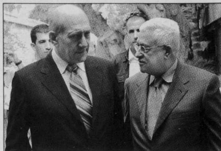
Ehoud Olmert (à gauche) et Mahmoud Abbas, hier à Jérusalem.

«Les participants-clés à cette réunion seront les Israéliens, les Palestiniens et leurs voisins dans la ré-