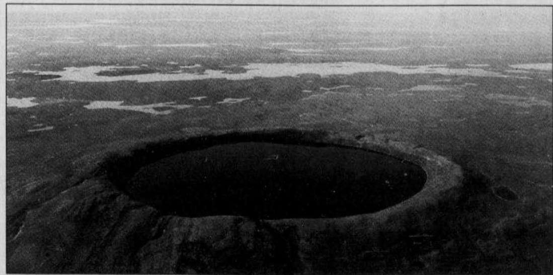
ROBERT FRÉCHETTE ARK

Le cratère des Pingualuit, joyau du parc national du même nom dont l'ouverture est prévue en novembre.