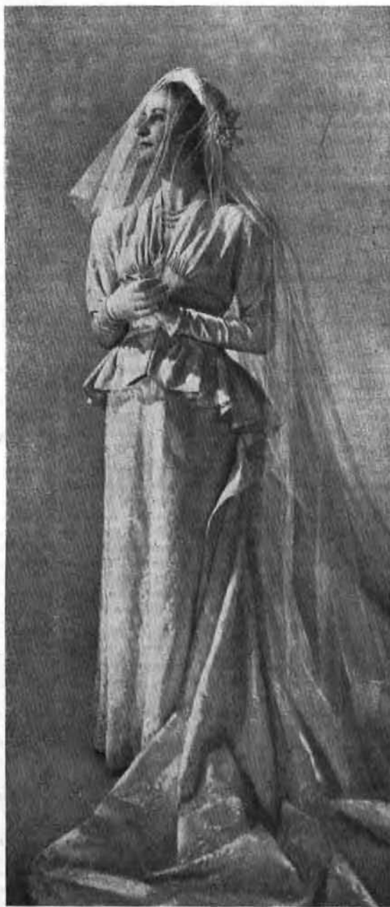
ILLUSTRATIONS DE L'OFFICIEL DE LA MODE ET DE LA COUTURE DE PARIS.