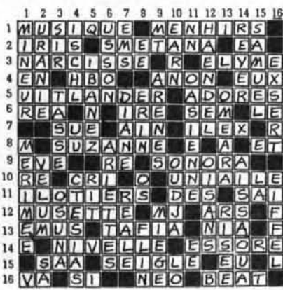
SOLUTION DU PROBLEME No 16

16.—Magasin de musique le plus complet au Canada. — Crier pour faire fuir le gibier, le poisson.