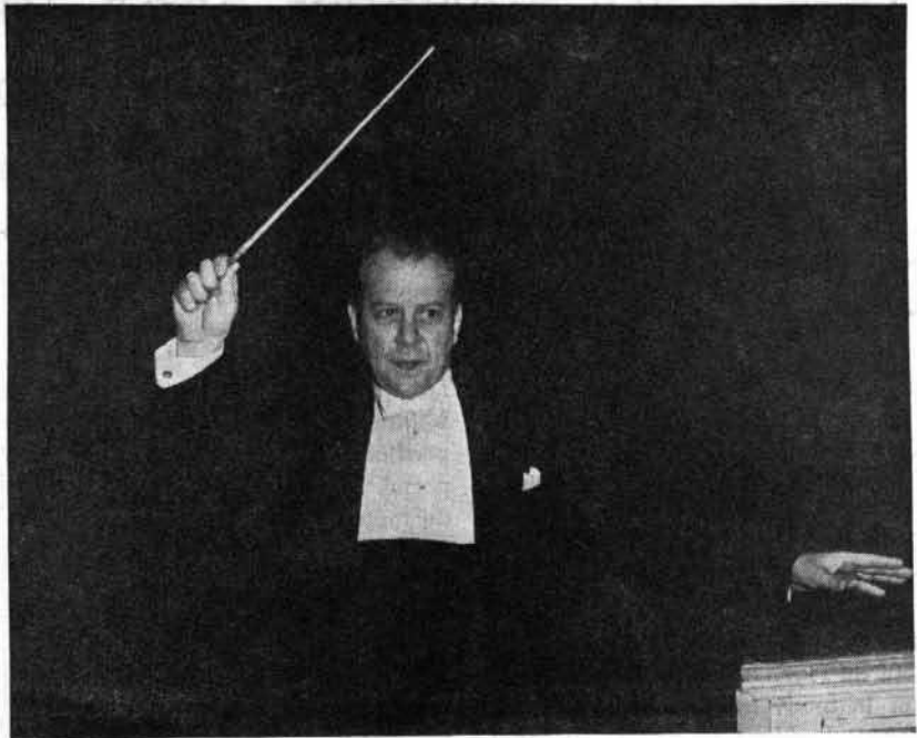
WILFRID PELLETIER au pupitre du Metropolitan Opera House, à New-York.

— La guerre a fait ses ravages dans le monde artistique comme dans les autres domaines. Sauf quelques centres, comme la Belgique où jaillit en ce moment un renouveau inespéré, les vieux pays mettront probablement des années avant de réorganiser