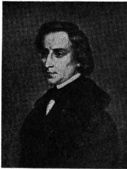
FREDERIC CHOPIN, d'après un portrait peint par un de ses amis polonais.

(2) On raconta un jour à Chopin que Liszt allait lui consacrer un article dans la Gazette musicale . "Je sais, je sais", dit Chopin, "il va me tailler un petit royaume dans son grand empire..."