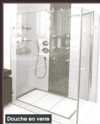
Douche en verre