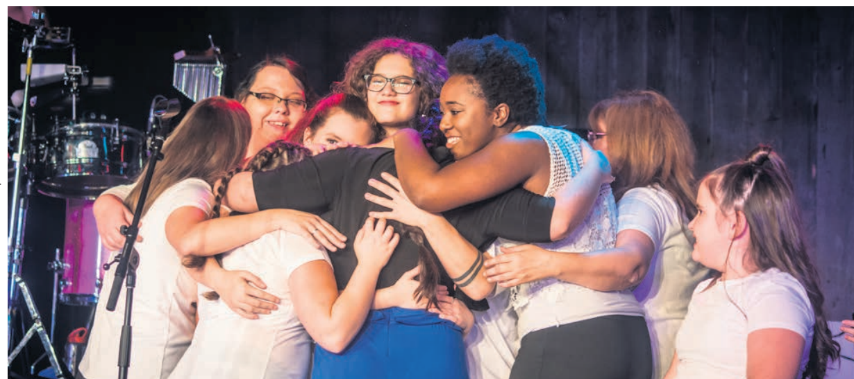
Photo prise lors d'un des spectacles organisés par Monde Art'monies entre 2018 et 2019.

L'humain est au cœur de la démarche de Monde Art'monies. L'organisme prône l'authenticité, la créativité, le respect et l'inclusion. S'il obtient le financement nécessaire, Monde Art'monies aimerait accueillir les jeunes de toutes origines, croyances et situations, en leur offrant un espace sûr et inclusif pour développer leurs talents ainsi que leur confiance en soi. En offrant un espace de vie et d'expression artistique unique, ce lieu pourrait devenir un véritable repère pour les jeunes artistes et les passionnés des arts de la scène.