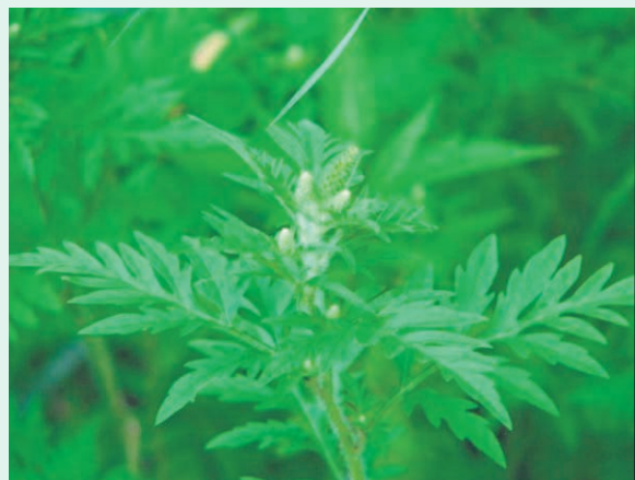
On peut reconnaître l'herbe à poux grâce à son feuillage dentelé, semblable à celui des carottes.

Pour en savoir davantage, il est possible de consulter la page Reconnaître et limiter l'herbe à poux sur Québec.ca et le Guide de gestion et de contrôle de l'herbe à poux et des autres pollens allergènes publié par le ministère de la Santé et des Services sociaux. (JJ)