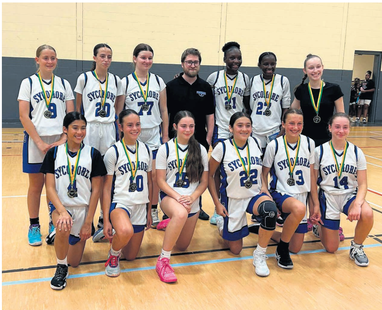
L'équipe U13 lors de sa conquête du tournoi Révolution.

Pour plus d'informations au sujet de Basketball Persévérance, visitez la page Facebook (@basketballperseverance) ou le site https://www.associationbasketballperseverance.com . (MB)