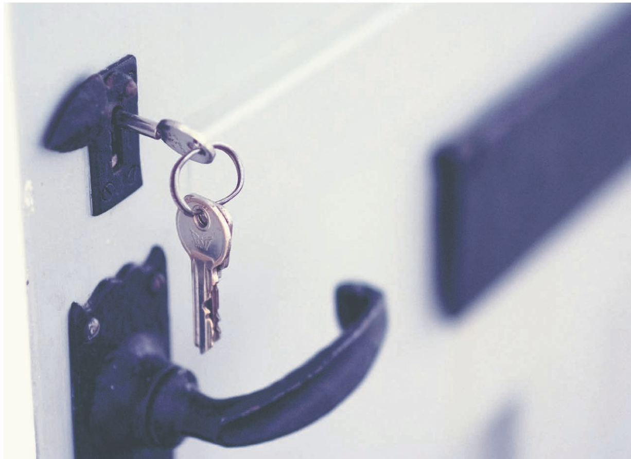
Dans Lanaudière, deux projets totalisant 36 logements seront soutenus.

« Tout le monde mérite d'avoir un chez-soi et le Fonds pour le logement abordable est l'un des moyens que nous mettons en œuvre pour que cela devienne une réalité