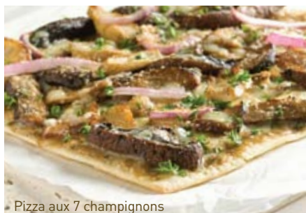
Pizza aux 7 champignons

FAITES VITE ! NOS DERNIÈRES DÉCOUVERTES SONT OFFERTES POUR UN TEMPS LIMITÉ À DÉGUSTER EN SALLE OU À LA MAISON