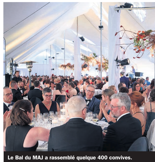
Le Bal du MAJ a rassemblé quelque 400 convives.