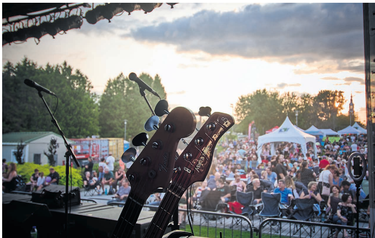
En plus des concerts gratuits des vendredis, un 9 e événement s'ajoute au calendrier.

Les billets pour cet événement spécial sont en vente dès maintenant au rythmesetcourant.ca ou via la billetterie du Café culturel de la Chasse-galerie. (MB)