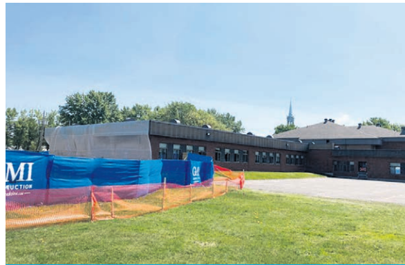
Les travaux se dérouleront sur plus d'un an à l'école primaire de la Source D'Autray à Lanoraie.

Cette école accueillera les élèves qui proviennent du quartier Saint-Pierre Sud et des alentours dans l'objectif de désengorger les autres écoles primaires de Joliette. L'établissement respectera les normes actuelles qui se veulent plus modernes, colorées et lumineuses. L'ouverture de l'école est espérée pour 2026.