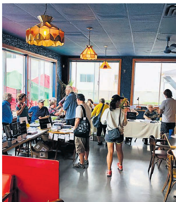
Lors de cette journée, les visiteurs pourront rencontrer plusieurs auteurs de la région.