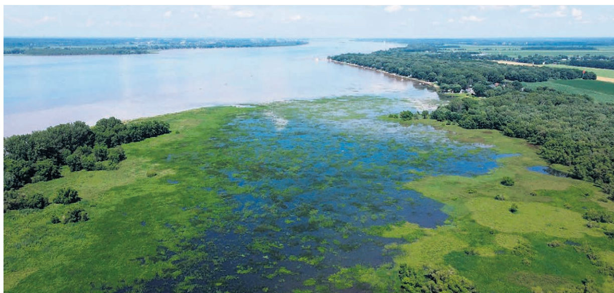
Grâce au projet du comité, la population pourra en apprendre davantage sur les milieux présents dans la Zone d'intervention prioritaire du lac Saint-Pierre.

À travers des cartes interactives et des informations sous forme de diaporamas, la population pourra en apprendre davantage sur ces milieux présents sur l'ensemble du territoire de la Zone d'intervention prioritaire du lac Saint-Pierre et de la Réserve mondiale de la Biosphère du