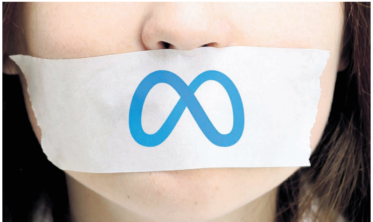
Meta, maison mère de Facebook, a commencé à bloquer le contenu journalistique canadien sur ses plateformes, privant ses utilisateurs au pays d'une information juste et de qualité.

Par conséquent, le journal L'Action D'Autray multiple dès aujourd'hui les vitrines sur lesquelles il partagera ses nouvelles. Son site Web, le www.lactiondautray.com , était déjà mis à jour régulièrement et continuera de l'être. On y trouve également chaque semaine le journal en format électronique. Les lecteurs qui ne sont pas encore abonnés à son infolettre hebdomadaire sont invités à s'inscrire gratuitement pour recevoir leurs nouvelles par courriel ( bit.ly/infolettreautray ). Enfin, le journal a ses comptes LinkedIn ( www.linkedin.com/showcase/l-action-d-autray ) et Twitter