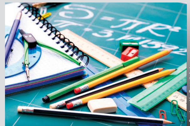
Grâce aux dons offerts par la population, les enfants issus de familles défavorisées pourront mettre la main sur le matériel scolaire nécessaire à leur réussite.

Ainsi, les 17 et 18 août prochains, les magasins IGA et Metro ont autorisé que la Société Saint-Vincent-de-Paul de la région de Berthier soit présente dans leurs entrées pour recevoir des dons qui aideront les jeunes à réussir leur année scolaire. La SSVP remercie à l'avance les donateurs pour leur générosité. Si une personne n'a pas d'argent liquide sur elle, il sera possible de faire un don par Interac. Il suffira d'entrer l'adresse ssvpb623@gmail.com et d'inscrire la réponse à la question qui est ssvp. (JJ)