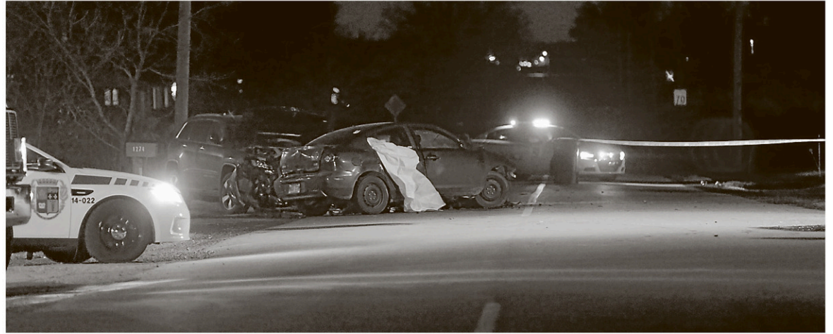
Une collision frontale entre une Mazda et un véhicule de type Jeep Grand Cherokee a fait une victime, mercredi soir à Granby.

GRANBY — Un Granbyen de 26 ans a péri tragiquement, mercredi soir, dans une collision frontale survenue à l'endroit même où une dame âgée a été heurtée mortellement, il y a un peu plus d'un mois.