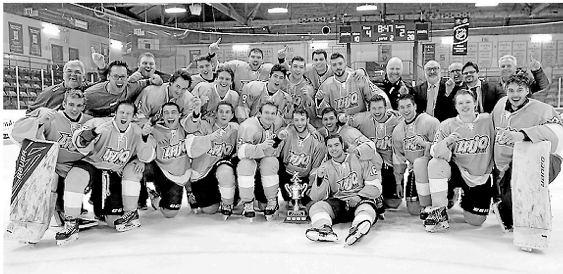
Les étoiles de la section Martin-St-Louis de la LHJAAAQ ont fêté dignement leur conquête.

Les joueurs de la division St-Louis ont fait les choses en grand mercredi alors qu'ils ont gagné leurs trois matchs, soit le dernier de la ronde préliminaire (1-0 face à la section Adam-Oates