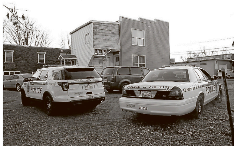
En parallèle, les forces de l'ordre ont perquisitionné une résidence sise au 459, rue Cowie.

« Ça [les arrestations] va faire du bien. Ça va redevenir plus calme dans le quartier », ajoute la Granbyenne.