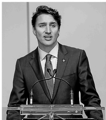
Le premier ministre canadien, Justin Trudeau

dizaines de militaires pour dispenser dans d'autres pays une formation en matière de maintien de la paix. «C'est un savoir-faire que nous avons durement acquis en Afghanistan et en Irak, deux des environnements opérationnels les plus difficiles», a indiqué mercredi M. Trudeau, venu lui-même dévoiler la contribution du Canada, dans le cadre de la réunion des ministres de la Défense sur le maintien de la paix des Nations unies, à Vancouver.