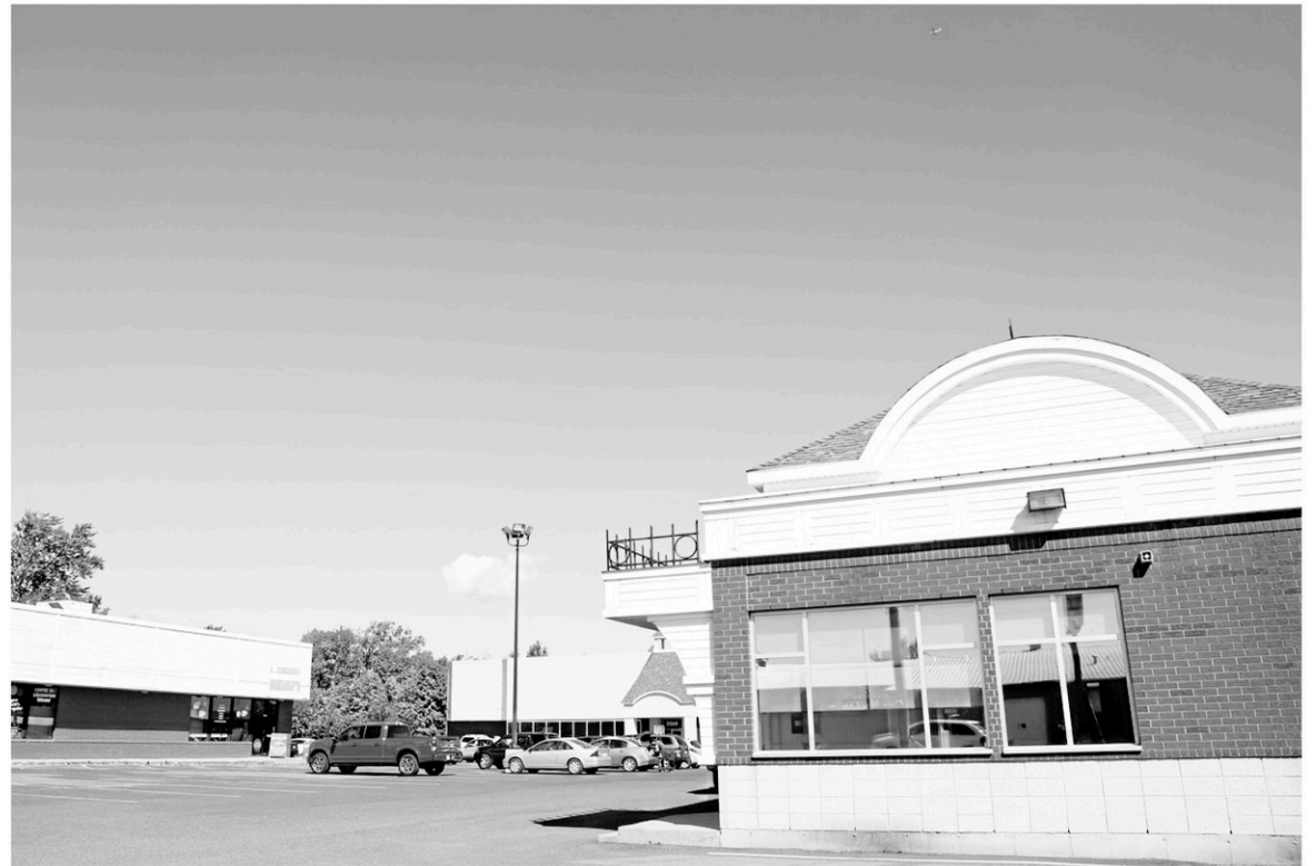
Le projet commercial estimé à quatre millions de dollars est conditionnel à un changement de zonage qui permettrait l'ajout d'une station-service dans le secteur nord de la route 112.