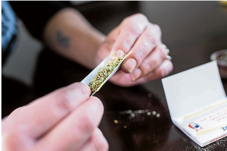
Jeudi, Québec doit déposer son propre projet de loi visant à encadrer la vente et la distribution du cannabis.

Mais le gouvernement du Québec n'est pas le seul acteur à réclamer plus de temps avant de lancer ce nouveau régime. Déjà, de nombreux corps policiers ont déjà fait savoir à Ottawa qu'ils ne seraient pas prêts à temps pour composer avec cette nouvelle réalité juridique, les policiers ayant notamment besoin d'une période de formation et d'outils pour