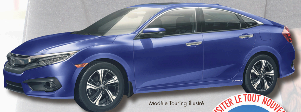
Modèle Touring illustré

Transport et préparation inclus. 12c/km excédentaire.