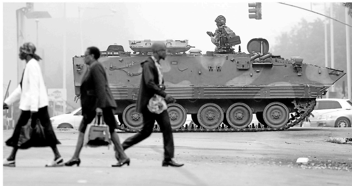
Les habitants de la capitale, Harare, ont contribué au calme en vaquant à leurs occupations habituelles, en dépit de la présence dans les rues de soldats armés montés sur des blindés.

Le président sud-africain Jacob Zuma a annoncé l'envoi de ses ministres de la Défense et de la Sécurité d'État au Zimbabwe pour rencontrer les généraux et M. Mugabe. Il a dit espérer que l'armée zimbabweenne respectera la Constitution du pays et que la situation « sera contrôlée ».