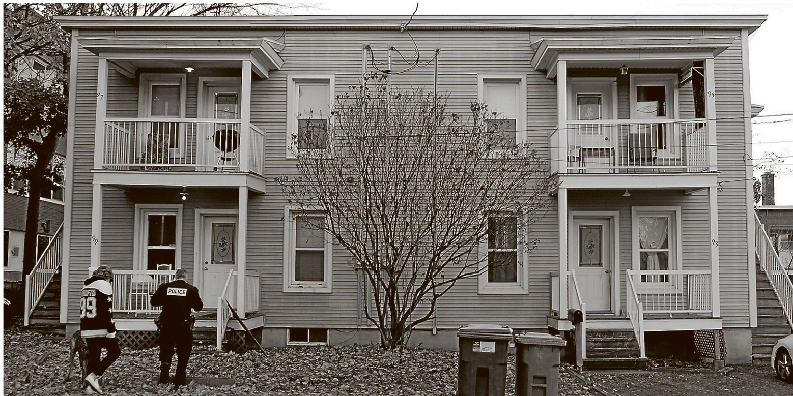
C'est grâce à des informations transmises par le public en septembre que les enquêteurs ont pu perquisitionner trois appartements d'un quadruplex situé dans la rue Charron.

En parallèle, les forces de l'ordre ont perquisitionné une résidence sise au 459, rue Cowie.