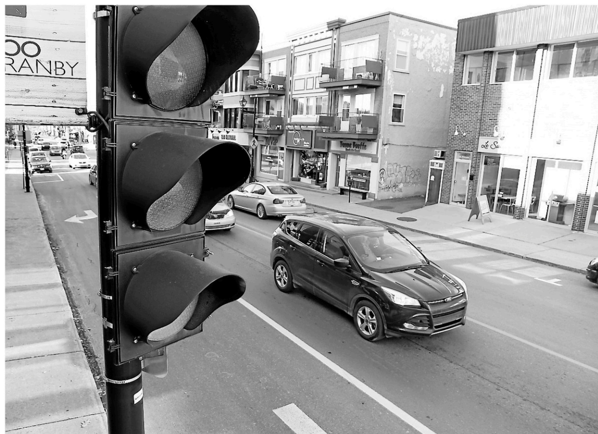
Les feux de circulation de l'intersection des rues Principale et Johnson sont en mode clignotant jusqu'à nouvel ordre.

Pour sa part, Luc Boulanger laisse entendre qu'il pourrait à nouveau s'adresser au conseil municipal afin que des correctifs soient apportés à une autre intersection dont il juge les feux de circulation désuets: celle des rues Cowie et Robinson. Un flot important de circulation est observé sur cette dernière rue à certains moments de la journée, mais les feux déclinent toujours les mêmes cycles, déplore le citoyen.