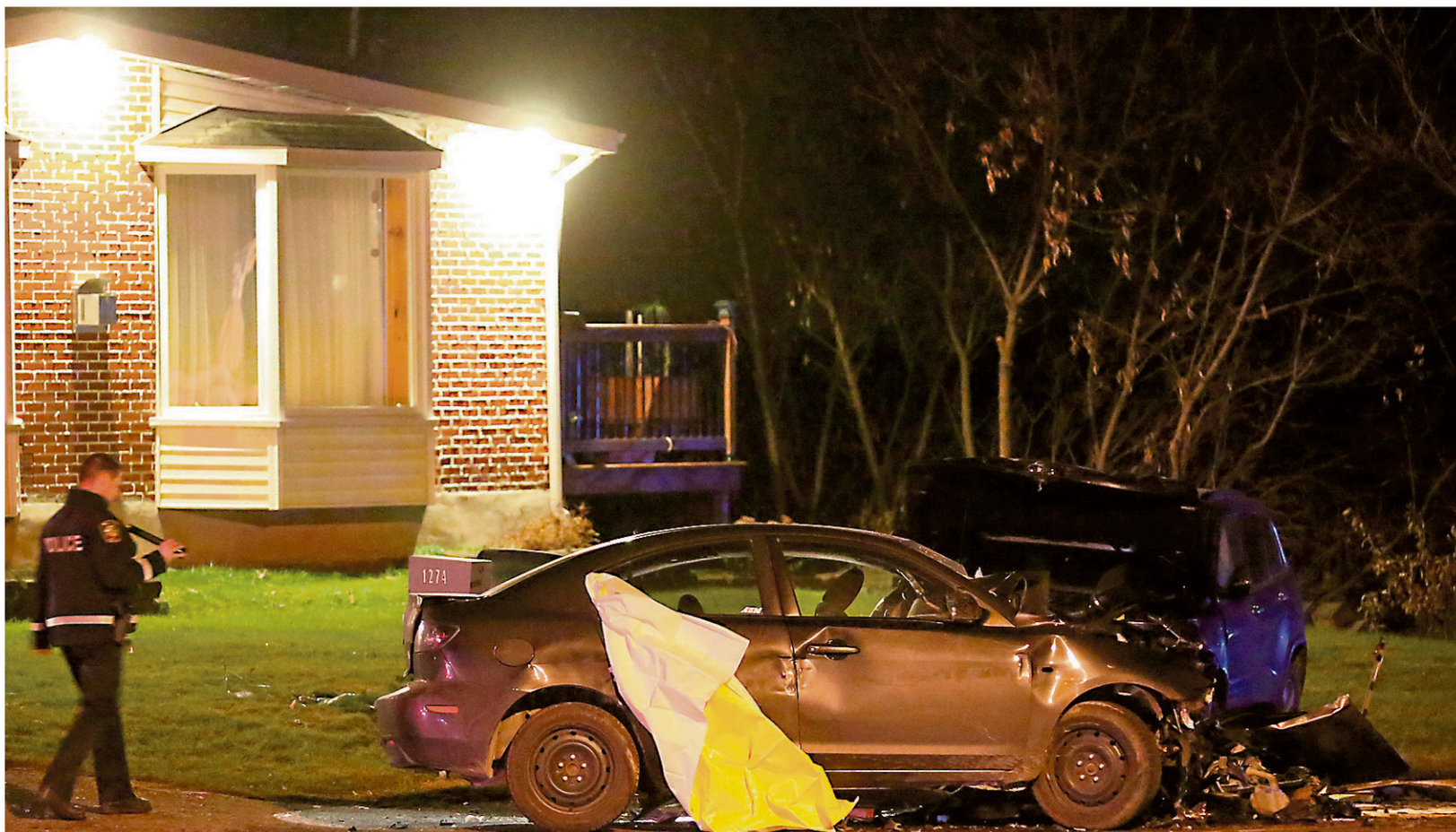
COLLISION FATALE RUE COWIE