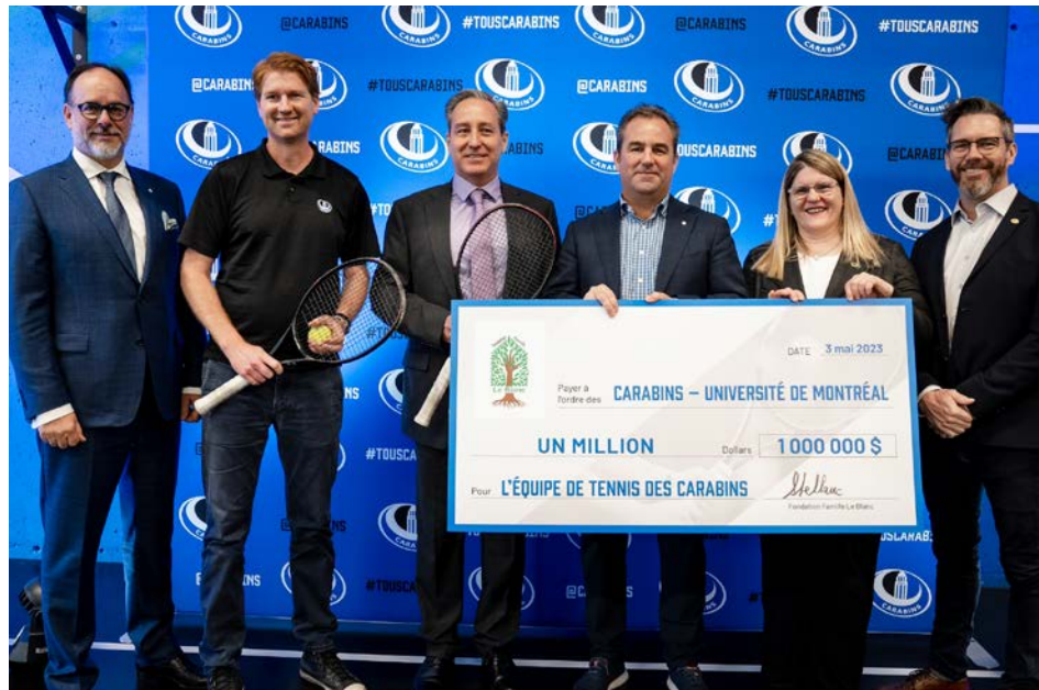
La Fondation Famille Le Blanc a fait un don d'un million de dollars à l'Université de Montréal.