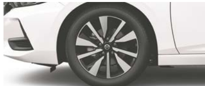
Jantes en alliage de 17 po de série