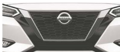
Calandre en V chromée de série