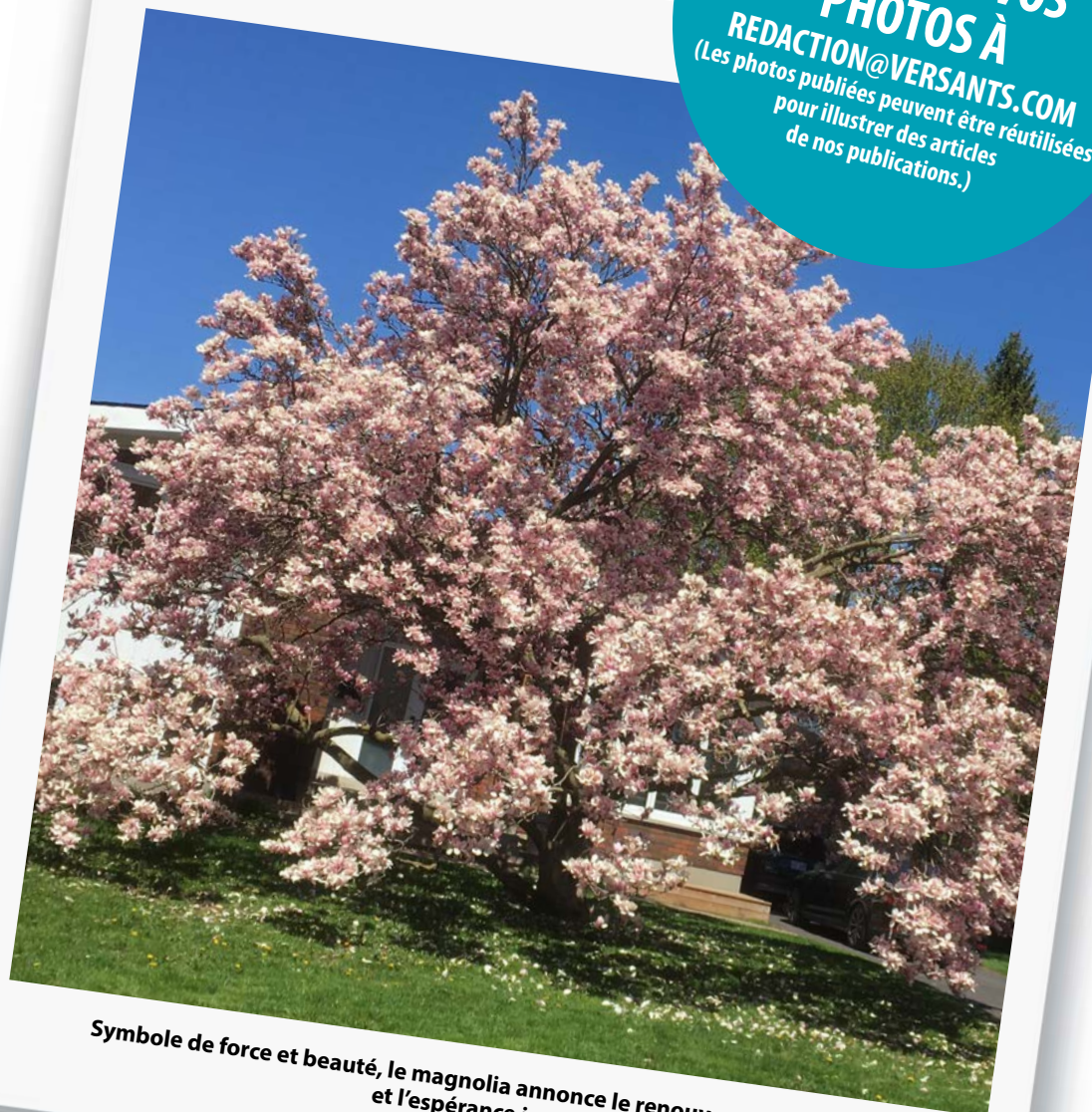
Symbole de force et beauté, le magnolia annonce le renouveau du printemps et l'espérance joyeuse.

FAITES-NOUS PARVENIR VOS PHOTOS À REDACTION@VERSANTS.COM (Les photos publiées peuvent être réutilisées pour illustrer des articles de nos publications.)