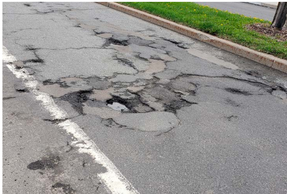
La rue Principale à Sainte-Julie.

Il faut savoir que la Belle Province compte plus de 320 000 km de route. Là-dessus, seulement 30 000 km sont sous la responsabilité du ministère des Transports. Les 290 000 km restants sont gérés par les municipalités.