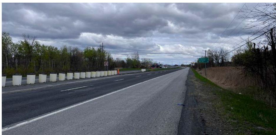
Des travaux seront effectués sur la route 116 Est, en direction de Beloeil.

Amorcées cette semaine, ces interventions, prévues jusqu'à la fin du mois, seront réalisées durant la nuit la semaine afin de limiter les répercussions des entraves sur la circulation.