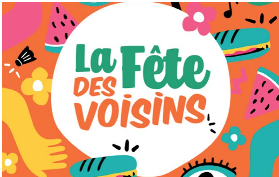
La Fête des voisins existe depuis 2006 au Québec.

Il s'agit d'un événement rassembleur et festif. La Fête des voisins encourage les