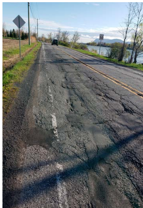
Le chemin Richelieu à Saint-Basile.