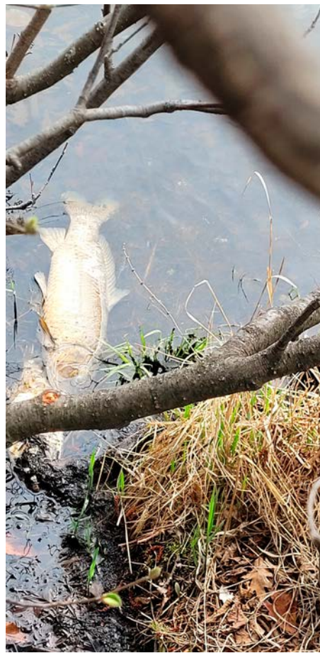
Des carcasses de carpes ont été aperçues à nouveau au lac du Moulin.

Contacté par Les Versants , le ministère de l'Environnement, de la Lutte contre les changements climatiques, de la Faune et des Parcs (MELCCFP) confirme qu'il n'est pas revenu sur le terrain depuis sa première interven-