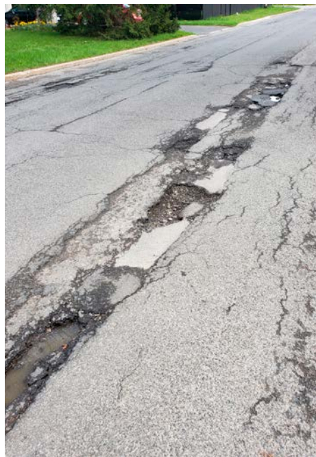
La rue Goyer à Saint-Bruno.