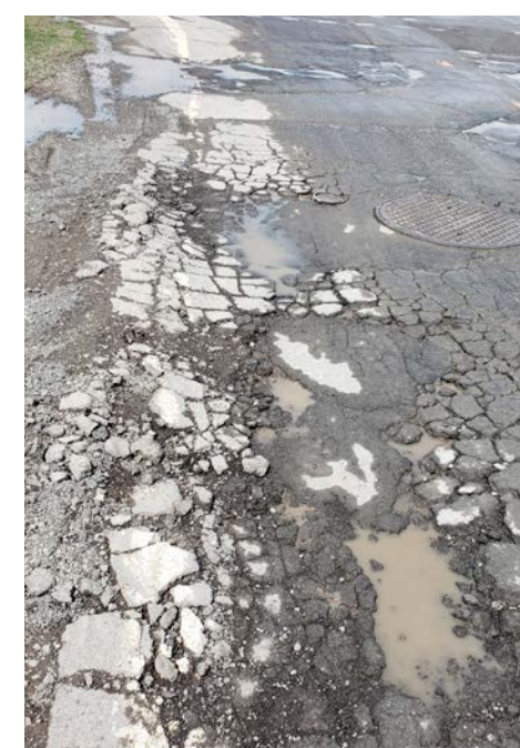
La rue Graham-Bell à Saint-Bruno.

« Il est possible de produire des chaussées plus durables en augmentant les épaisseurs et en utilisant les bons matériaux. » - Alan Carter