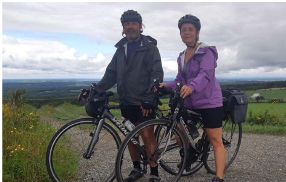
Les deux cyclistes pédaleront de Victoria, en Colombie-Britannique, jusqu'à Beloeil.

Pour l'hébergement, les cyclistes ont décidé de faire du camping. C'est-à-dire qu'ils transporteront avec eux tout le matériel nécessaire pour leur bivouac moyennant un poids supplémentaire de 36 livres chacun. « On espère pouvoir