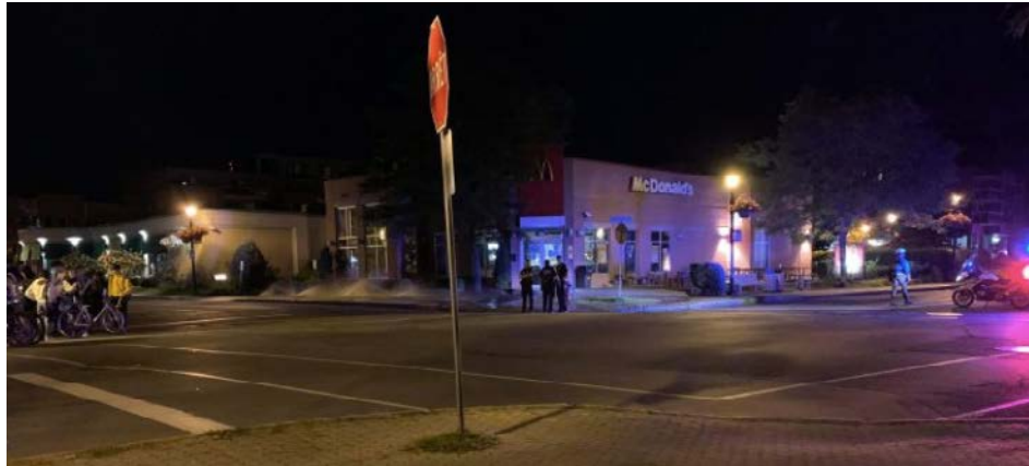
Les jeunes se rassemblent dans les rues de Saint-Bruno-de-Montarville.

« Une présence policière est effectuée régulièrement dans les stationnements des commerces et aussi dans les commerces, se targue la sergente du SPAL, Mélanie Mercille. Nous invitons les propriétaires des commerces à se munir de caméras