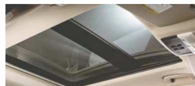
Toit ouvrant panoramique