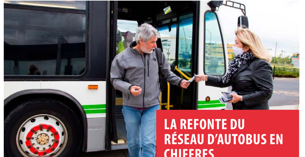
Le travail d'exo pour la refonte de son réseau d'autobus à Sainte-Julie débuteront en 2014 avec la phase 7.

La pandémie de COVID-19 a déjoué bien des prédictions en termes de transports en commun et a fait changer les habitudes des usagers. « On le voyait déjà avant la pandémie, mais