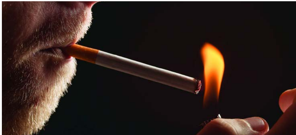
La cigarette traditionnelle est encore très présente.

Malgré la popularité des produits de vapotage, la cigarette traditionnelle demeure le produit préféré des fumeurs.