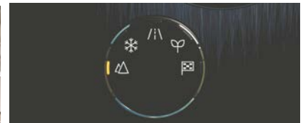
Traction intégrale intelligente avec 5 modes de conduite