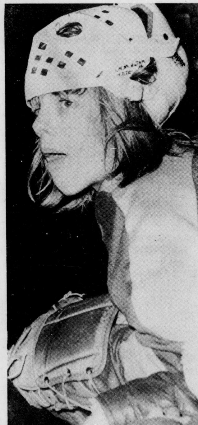
Un cerbère aux aguets. Ce joueur du St-Tite surveille de près les péripéties de la rencontre.