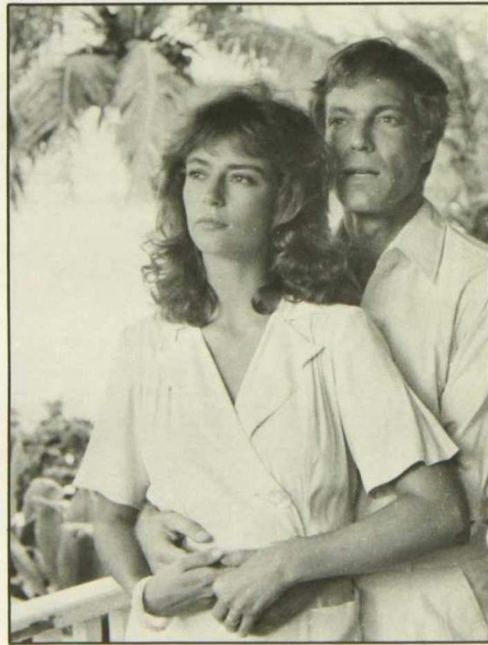
Rachel Ward et Richard Chamberlain