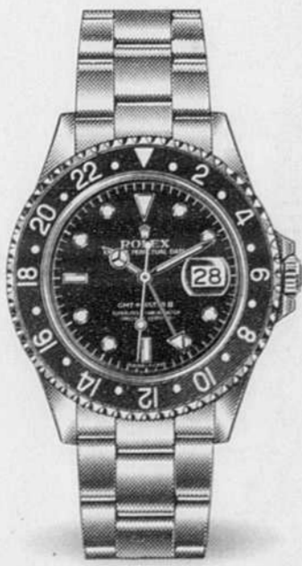
OYSTER PERPETUAL GMT-MASTER II

Afin de répondre aux besoins des gens qui voyagent ou travaillent dans des conditions extrêmes, Rolex a créé la GMT-Master et Explorer II, toutes deux comprenant une aiguille supplémentaire afin de consulter deux fuseaux horaires simultanément. En outre, le modèle GMT-Master a été conçu avec une lunette tournante facilitant la lecture des deux fuseaux horaires.