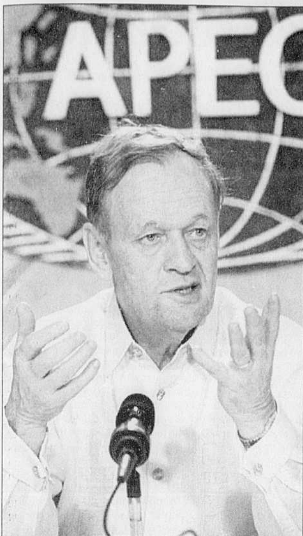
Jean Chrétien a tenu une conférence de presse à l'issue du Forum de coopération économique Asie-Pacifique.

Le plan d'élimination des barrières douanières sur les produits électroniques obtient l'appui de l'APEC en dépit des réticences des pays en développement