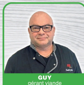
GUY gérant viande