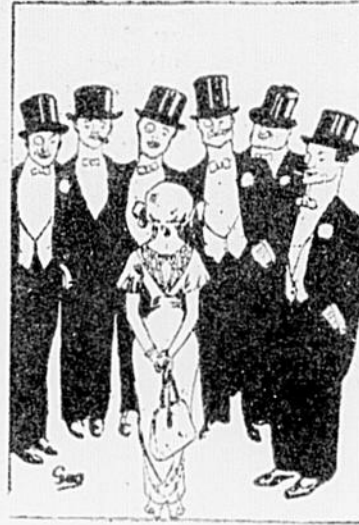
Mlle Parizel a des admirateurs en plein.