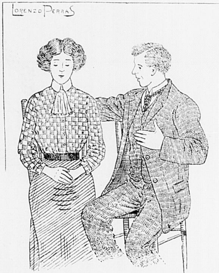
Dessin de Lorenzo Perras.