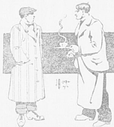
Dessin de M. Millette.

—Votre état? —Professeur de joune, Monsieur.