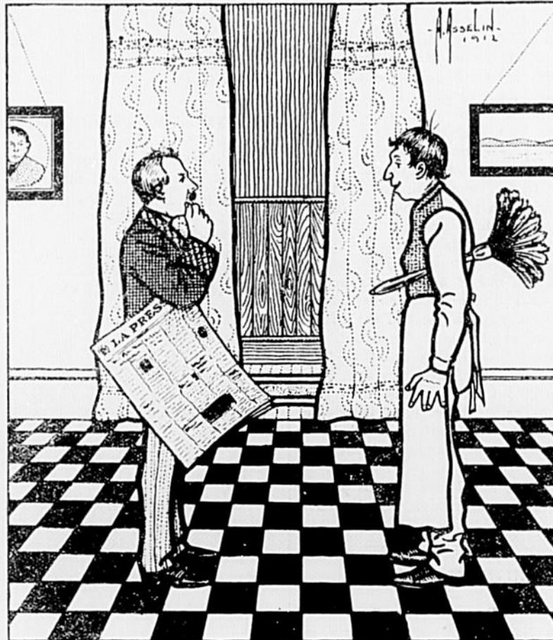
Dessin de Alfred Asselin.