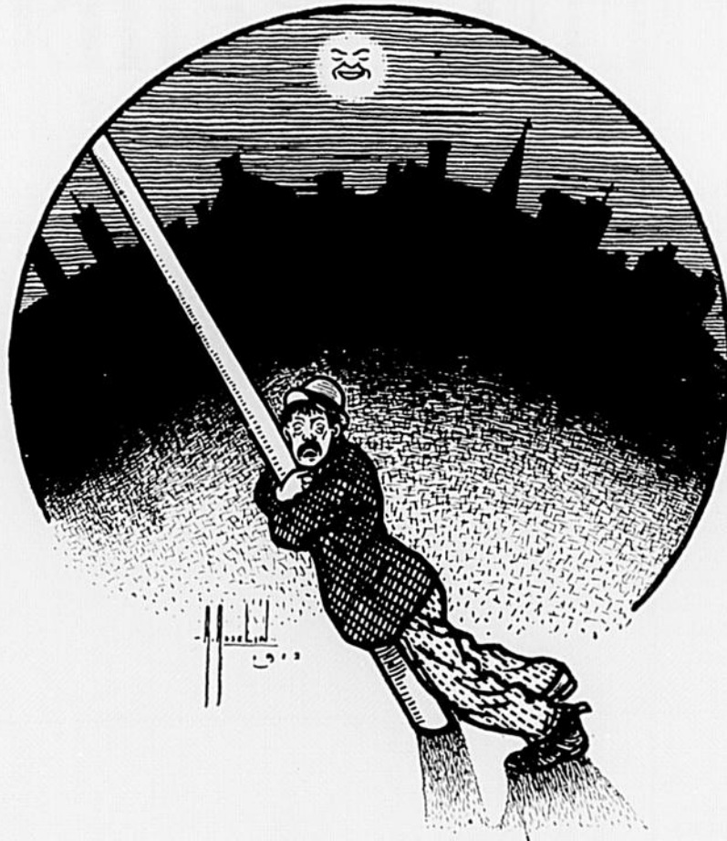
Dessin de Alfred Asselin.

Parmi ces animaux eussé-je été profane? Je ne suis, après tout, pas plus bête que l'âne, Je n'aurais pas été déplacé dans ce lieu, J'avais aussi le droit, moi, de voir naître un Dieu." Dieu le Père sourit dans sa barbe plus blanche Que la neige des monts, virginal avalanche, Magnifique manteau d'hermine des sommets, Puis il dit au plaignant: —"On t'a fait du tort, mais, Comme, en somme, tu vauds bien autant que les autres,