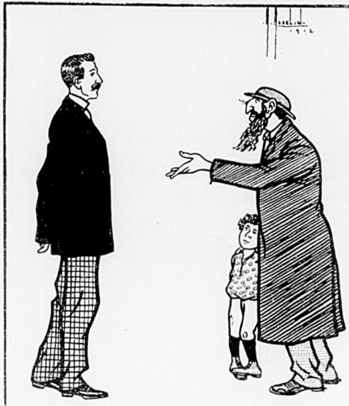
Dessin de Alfred Asselin.

Cet apothicaire a pour concitoyens des fabricants de boutons — deux frères associés qui se nomment Ber. Ces deux négociants guignent tous deux la fille du percepteur, qui a une dot assez ronde. Ber aîné fut évincé et Ber jeune l'emporta. Depuis ce jour, le pharmacien appelle le premier "Ber-n'a-dot" et le deuxième "Ber-gobe-somme"!