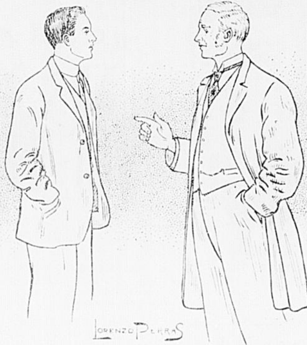
Dessin de Lorenzo Ferras.