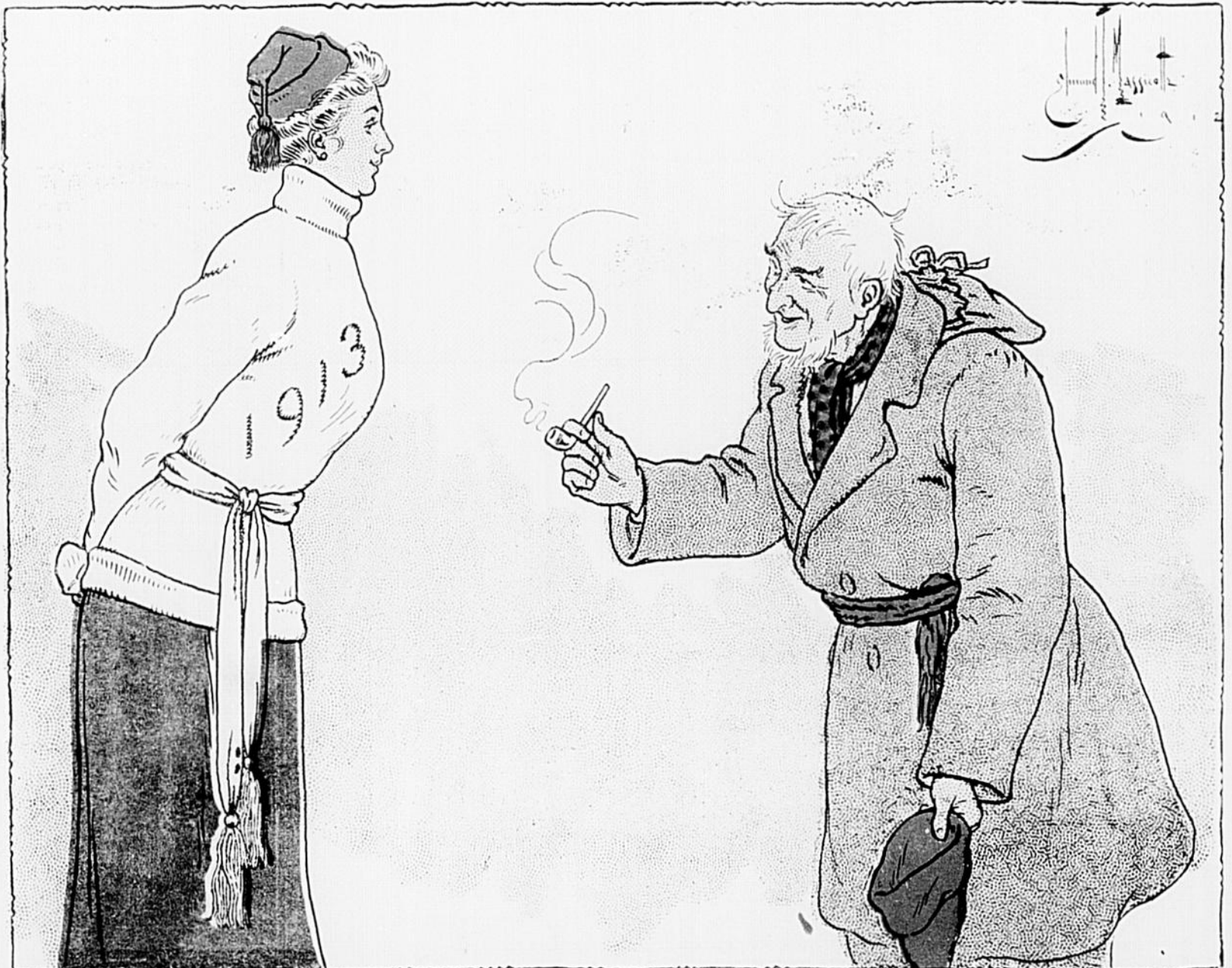
LADEBAUCHE.—Mam'zelle 1913, laissez-moi vous souhaiter la bienvenue au nom de tous les bons Canayens. J'espère que votre règne apportera de bonnes et belles choses et le paradis à la fin de l'année.