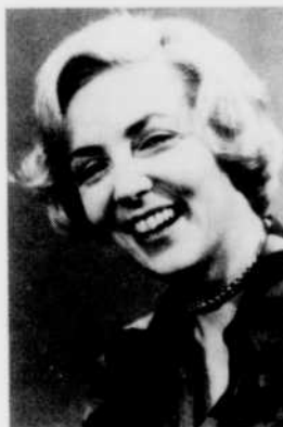
Animatrice: Lizette Gervais . Réal.: Jacques Demers.