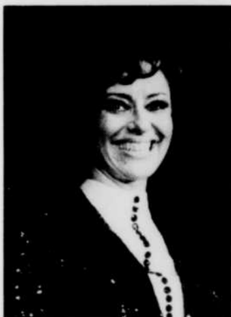
En haut: Robert Charlebois. A droite: Catarina Valente Julien Clerc Charles Aznavour