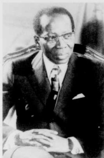
M. Léopold Sedar Senghor

En plus des opinions exprimées, «Le Choc des cultures» nous permettra d'entendre le romancier et musicien Francis Bebey, nous dire un passage d'une oeuvre d'Aimé Césaire, et de voir Manu Dibango diriger un petit ensemble interprétant quelques extraits de ses récentes compositions.