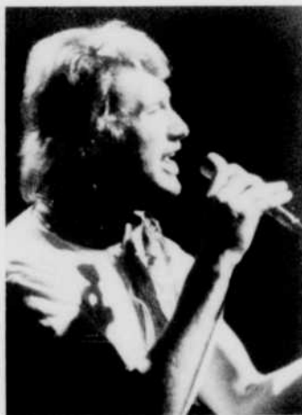
A gauche: Johnny Halliday Nana Mouskouri Jacques Brel