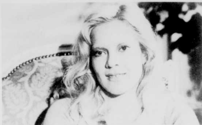
Georges Brassens, Sylvie Vartan et Micheline Presle.

— «Sylvie Vartan que j'avais rencontrée il y a dix ans tout juste. A ce moment, elle était une jeune fille de vingt-deux ans adulée, pas encore mariée à Johnny Halliday et elle m'avait dit que la chanson ne l'intéressait pas. Elle m'avait avoué qu'elle voulait devenir comédienne, une grande comédienne de cinéma comme Jeanne Moreau. Cela m'a permis de faire le point avec elle et de lui demander ce qu'était devenu son rêve. Finalement, elle a obtenu un petit rôle dans un film