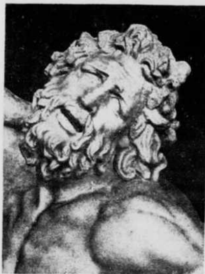
TÊTE DE LAOCOON