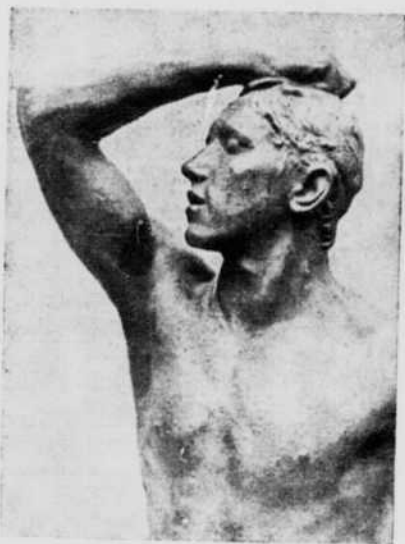
L'ÂGE D'AIRAIN par Rodin

Au mérite d'avoir écrit un ouvrage clair et d'une lecture passionnante, s'ajoute, chez l'auteur, celui de n'avoir pas tronqué les perspectives d'un sujet vaste et périlleux, d'avoir souligné à l'occasion les limites de l'information scientifique et d'avoir mené à terme avec un rare bonheur son projet de reconstituer à partir de vestiges la vie de la société humaine primitive. Qu'il traite des âges néolithiques, qu'il ressuscite les hommes du mésolithique ou qu'il évoque les temps paléolithiques, M. Fromentin ne le fait qu'en s'appuyant sur les données certaines de l'anthropologie, de la paléontologie, de la zoologie, de la dendrochronologie et de l'analyse pollinique. Sa documentation basée sur les analyses scientifiques les plus exactes, lui permet d'aborder l'étude de la flore, de la faune, de l'industrie, de la population, des pratiques funéraires, des modes de sépulture, du rituel magique de la chasse, de l'évolution des peintures et des gravures pariétales. Mais là où éclate avec le plus de force, croyons-nous, l'objectivité rigoureuse du savant qu'est M. Fromentin, c'est lorsqu'il confesse sans fausse modestie l'impuissance de la science actuelle à résoudre le problème des concepts religieux des hommes de la préhistoire, la difficulté de da-