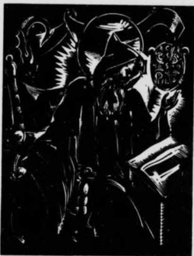
SAINT BENOÎT par dom André Boutou

Conscient de la rareté des documents mis à sa disposition pour cette recherche de nature plutôt psychologique, Dom Ryelandt s'est efforcé de serrer de près les deux seuls textes capables de lui dévoiler l'âme du saint : la Règle bénédictine et le récit des miracles de saint Benoît rédigé par saint Grégoire le Grand. A la lumière de ces sources, les deux seules vraiment authentiques, l'auteur s'est appliqué à discerner quels sont les points sur lesquels le saint Législateur insiste ou aime à revenir, à analyser sa manière personnelle de traiter certains sujets, à remarquer en quel sens il modifie et adapte les citations de Cassien, enfin à relever certaines expressions révélatrices de