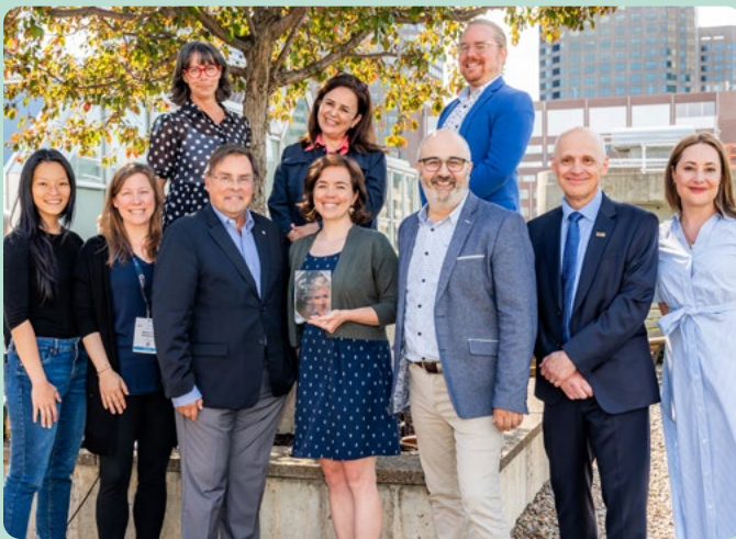
Personnel de la clinique de dentisterie sociale Dentaville

Pour en savoir plus sur le parcours de la lauréate du prix Mérite du CIQ, lisez notre portrait à la p. 8. ▶