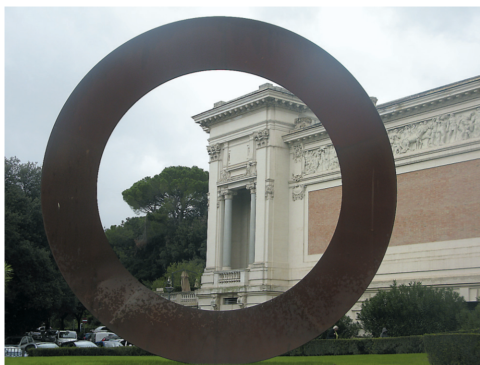
La Galerie nationale d'art moderne.