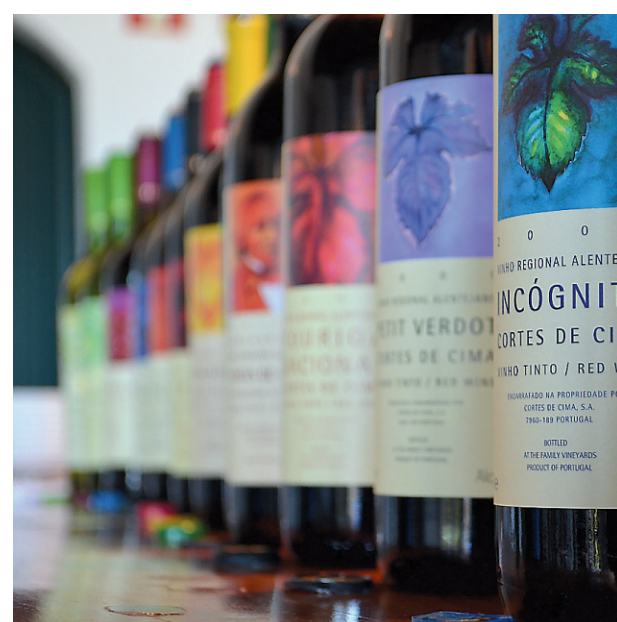
Bouteilles produites par Cortes de Cima.