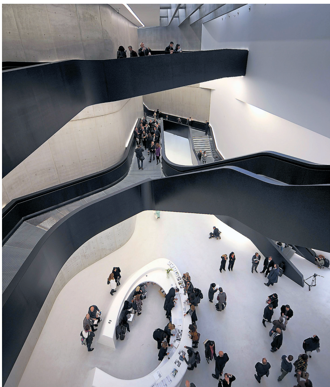
Conçu par l'architecte Zaha Hadid, le Musée national des arts du XXI e siècle accueille des expositions, des performances, des ateliers et des conférences.

Les expositions temporaires profitent d'espaces faciles à moduler. L'immense sculpture de sacs de plastique de toutes les couleurs placée sous la verrière est très attirante, de même que les sculptures de verre de l'artiste camerounais Pascale Marthine Tayou. Quant à l'installation sur l'évolution de l'art