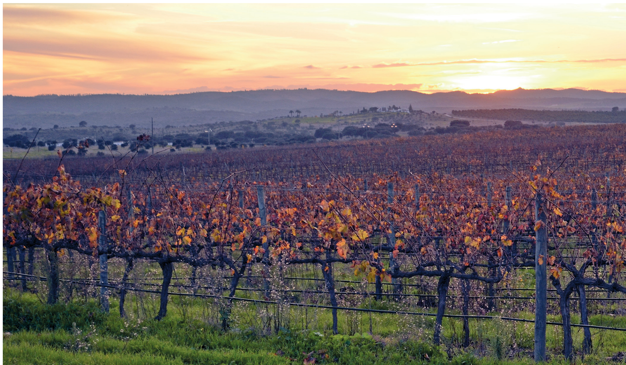
Le paysage viticole de l'Alentejo.