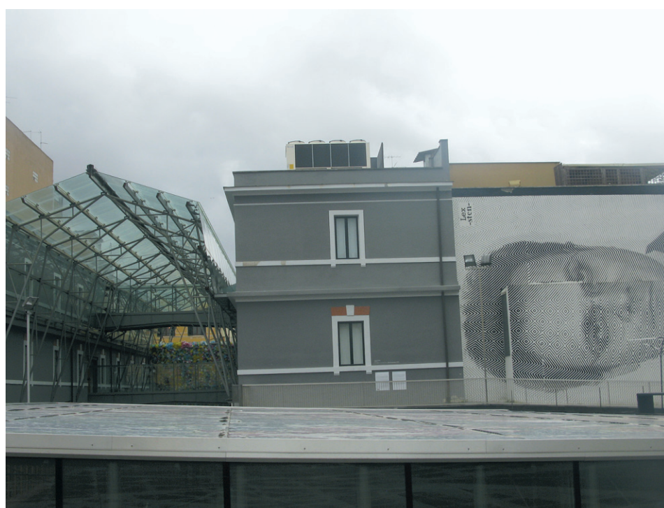
Le Musée d'art contemporain.