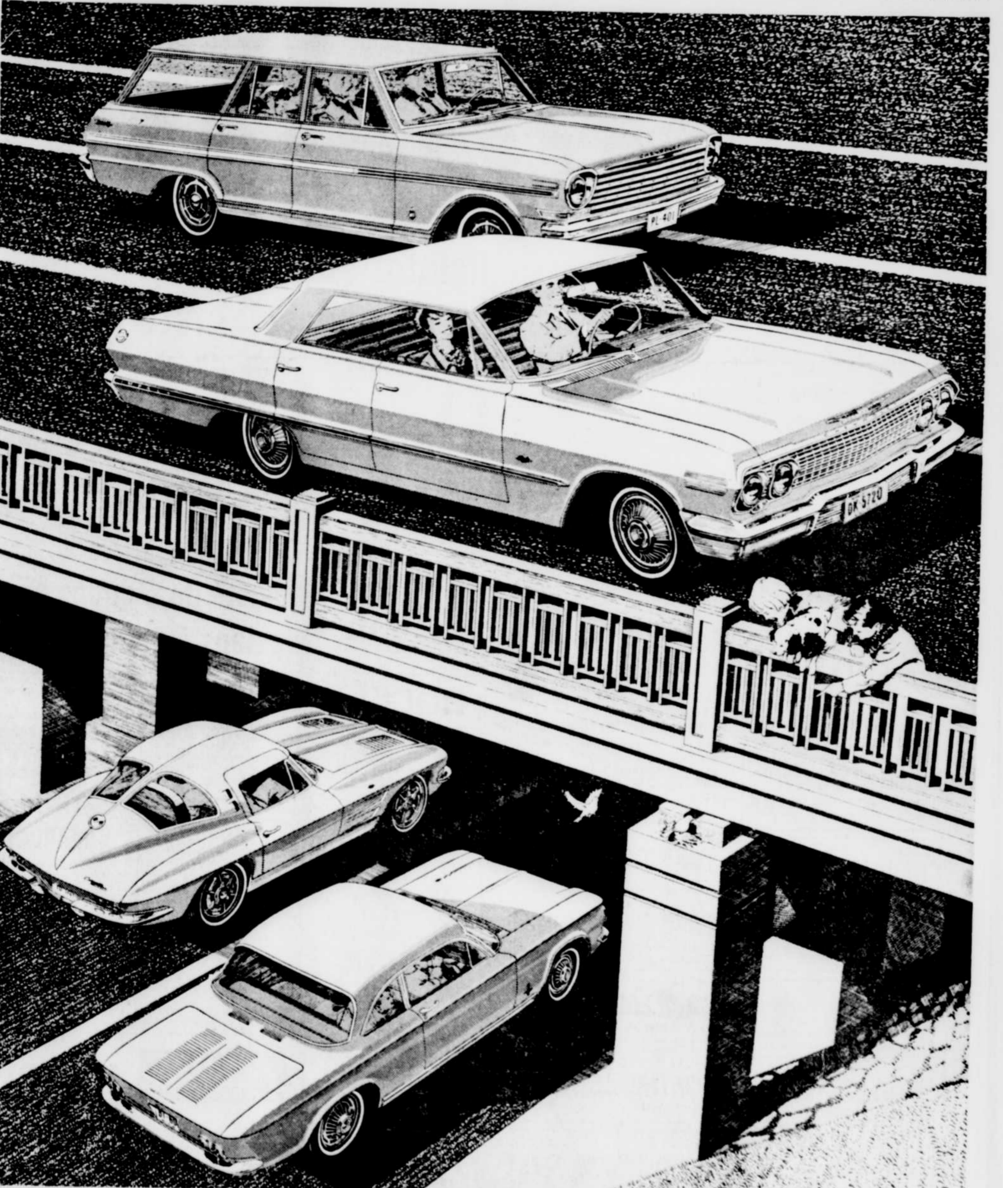
Une valeur General Motors. Ci-dessus, de haut en bas: station-wagon Chevy II Nova 400, sedan sport Chevrolet Impala, coupe sport Corvette Sting Ray et coupe club Corvaire Monza.

Elles sont exposées chez le concessionnaire Chevrolet de votre localité. Ne manquez pas l'émission télévisée "En habit du dimanche", tous les dimanches soir.