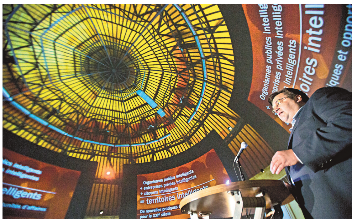
Denis Coderre a livré la pièce maîtresse de sa plateforme électorale devant le gratin «branché» de Montréal, mercredi, en prononçant le discours d'ouverture de la conférence Webcom.