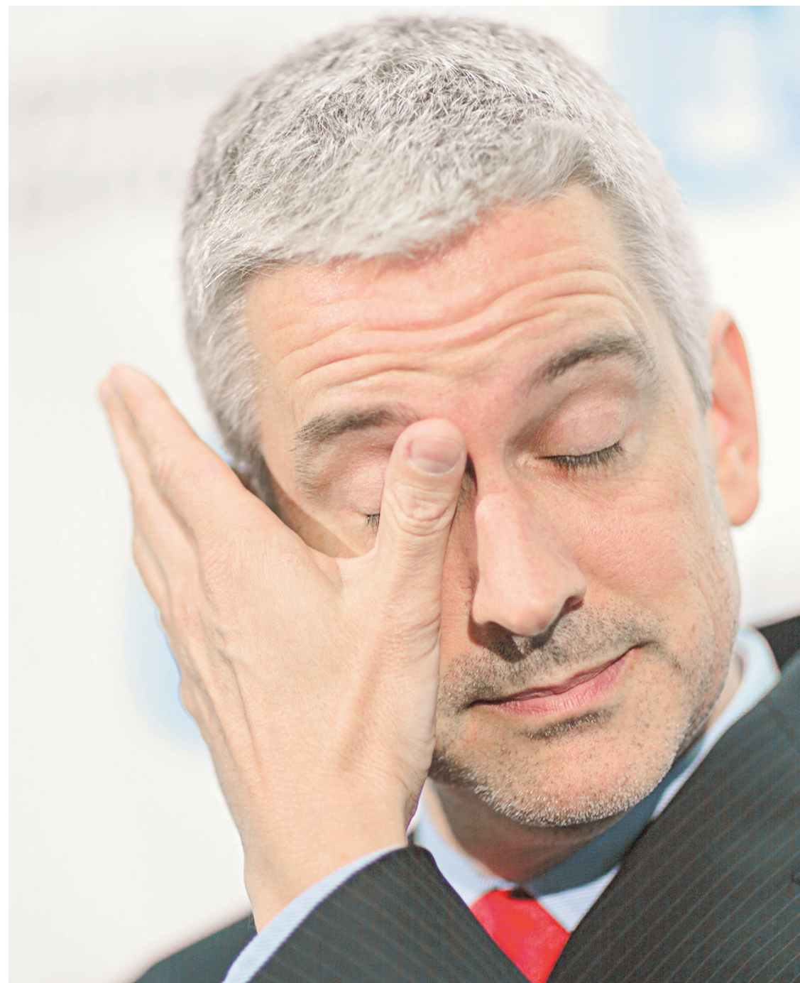
PEDRO RUIZ LE DEVOIR

Avis légaux..... B 4 Décès..... B 6 Météo..... B 5 Mots croisés..... B 2 Petites annonces..... B 6 Sudoku..... B 4