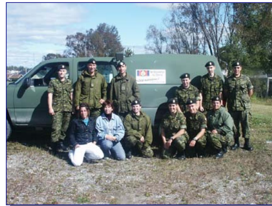
Participants à la Fête au Village (9 septembre 2006)