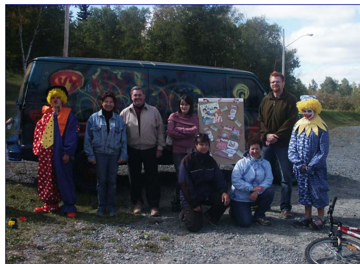
LANCEMENT DE LA RIPOSTE - 9 septembre 2006

L'impact qu'aurait eu le projet SEQUR aurait été beaucoup plus grand que l'impact que peuvent avoir les articles. Mais je pense que SEQUR aurait été un gros pow wow tandis que là, c'est plus tranquille. Ça se fait à plus moyen long terme et ça demande moins d'énergie... On a travaillé fort pour le projet SEQUR et y'avait un certain essoufflement... et si ça avait été accepté, on clanchait pour une autre année de fou!