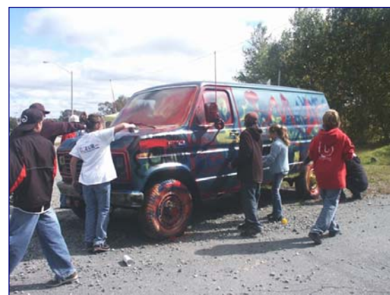
Participants à l'activité «Graffiti» de la Fête au Village (9 septembre 2006)