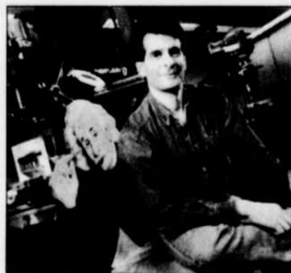
Trouvée dans Internet, une des rares photos de Dean Kamen

Le club d'investisseurs dans le projet «Ginger» comprendrait également John Doerr, mytique capital-risqueur