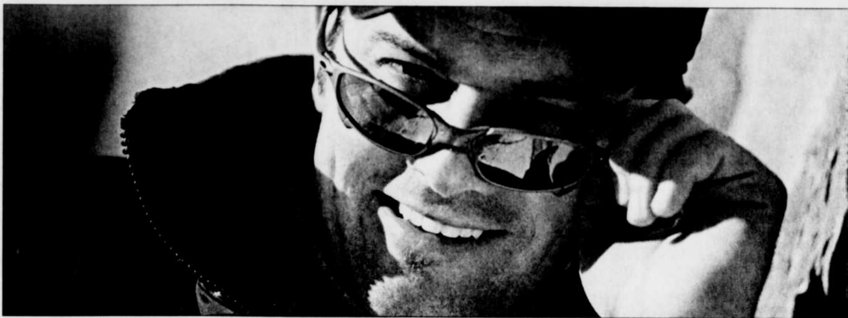
Le style chanteur de charme m'a permis de chanter, de faire des disques qui se vendaient, mais aujourd'hui, le jeune homme que j'étais est devenu un adulte et il a le goût d'atteindre les gens d'une autre façon », confie le chanteur originaire du Lac Saint-Jean.

Mario Pelchat avait une certaine amertume en entrant au gala; il n'était pas en nomination pour l'interprète de l'année et pourtant... Le vote de l'industrie, pour déterminer le gagnant de ce Félix, s'était passé bien avant que Je