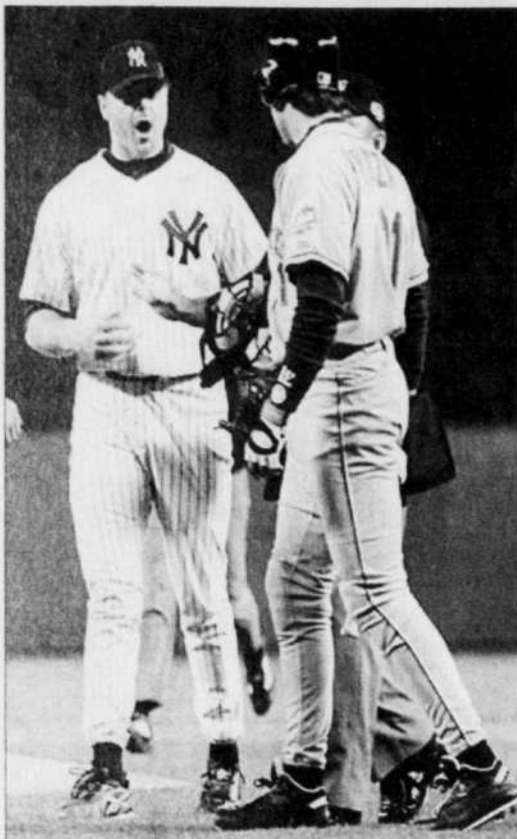
Le lanceur Roger Clemens, des Yankees, et Mike Piazza, des Mets, en pleine dispute lors du deuxième match de la Série mondiale.

Clemens avait alors été suspendu pour cinq matchs et avait écopé de 10 000 $ US d'amende. Il avait fait appel. Le commissaire Fay Vincent avait conclu que Clemens n'avait pas injurié l'arbitre mais avait décidé de maintenir la suspension en disant que la façon d'agir de Clemens avait été inacceptable.