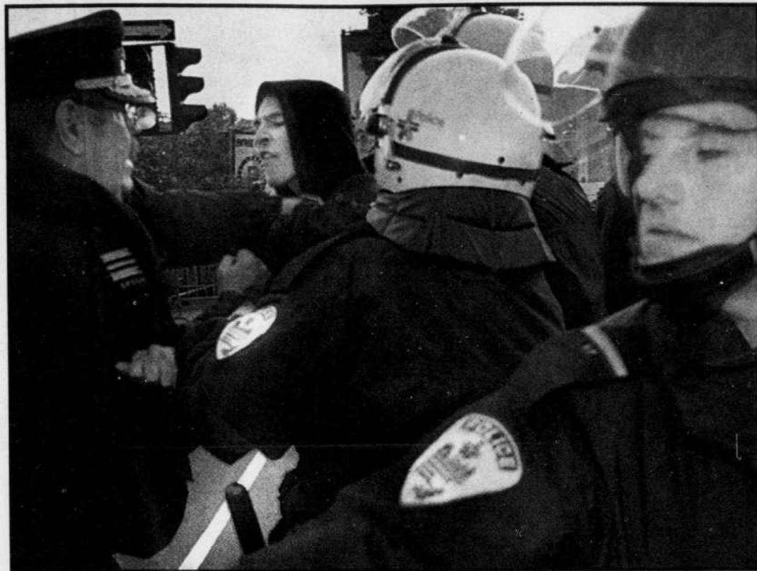
Deux seules arrestations ont marqué les manifestations d'hier.