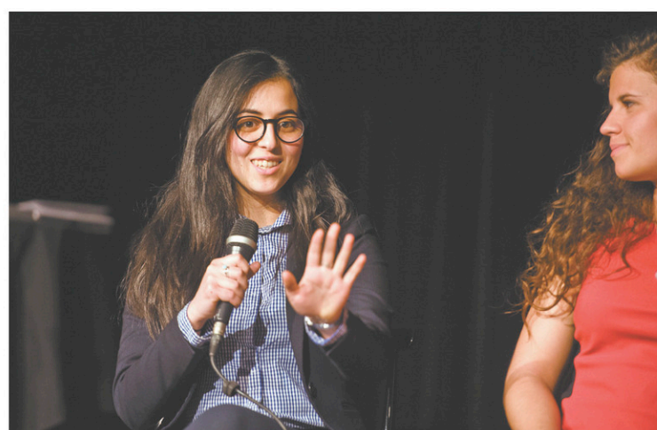
CATHERINE LEGAULT LE DEVOIR

Organisée par Les amis du Devoir , la rencontre visait à débattre de la façon dont ils entendent exercer leur pouvoir politique. La soirée s'est tenue dans le cadre de la remise des prix du Devoir de la presse étudiante.