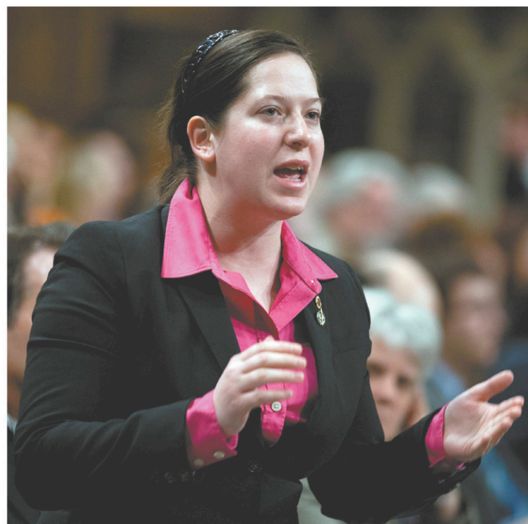
ADRIAN WYLD LA PRESSE CANADIENNE

En coulisse, l'entourage de la députée indique qu'il n'est pas question que ces allégations restent sans réponse publique. La forme de la réponse