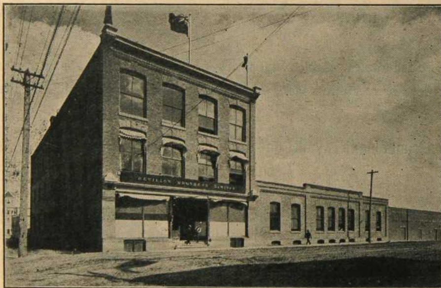
Etablissement Revillon Frères Ltée à Edmonton.