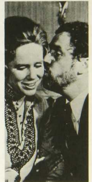
Dramatique réalisée par Ingmar Bergman, avec Liv Ullman et Erland Josephson. «Paula». Brutale-ment Johan rompt l'équivoque. Il a une liaison et, amoureux, a décidé de quitter Marianne. Celle-ci n'avait rien vu venir.