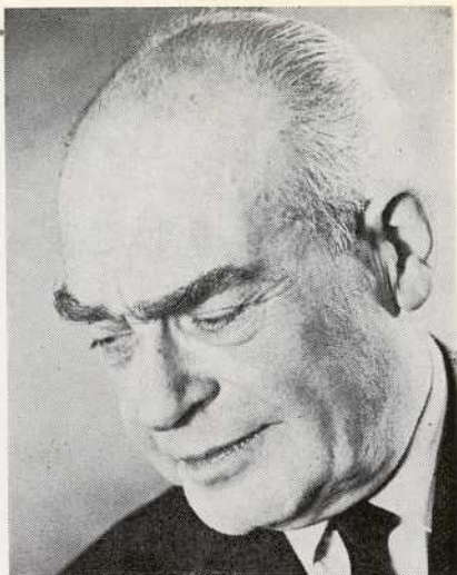
PAUL KLECKI chef d'orchestre / conductor

Dès le 1er octobre de cette année, Paul Klecki assumera la direction générale de l'Orchestre de la Suisse Romande, succédant au fondateur, Ernest Ansermet, qui continuera de participer à la saison musicale pour un certain nombre de concerts.