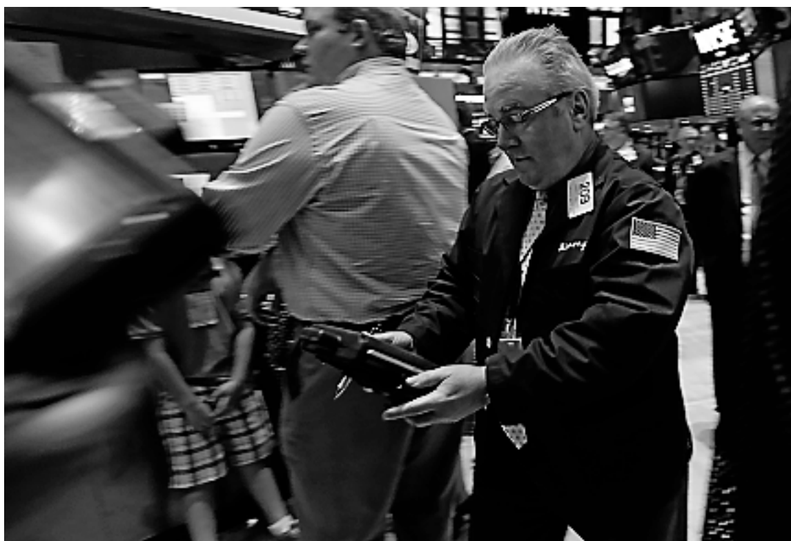
Deux gourous de la Bourse prévoient des chutes prochaines de plus de 20% des marchés.

L'analyste technique américain a développé en 1986 un indicateur basé sur la concordance entre le différentiel de titres à la hausse et à la baisse avec l'évolution des cours, à la Bourse de New York. Le «Cook Cumulative Tick» n'a pas été aussi radicalement débalancé depuis le troisième trimestre de 2007,