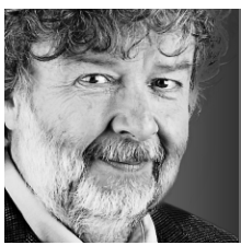
RUDY LE COURS ANALYSE

L'économie américaine prend du mieux. À tel point que la Réserve fédérale (Fed) n'hésite plus à le confirmer et à donner des signes que le début de la normalisation de sa politique monétaire approche.