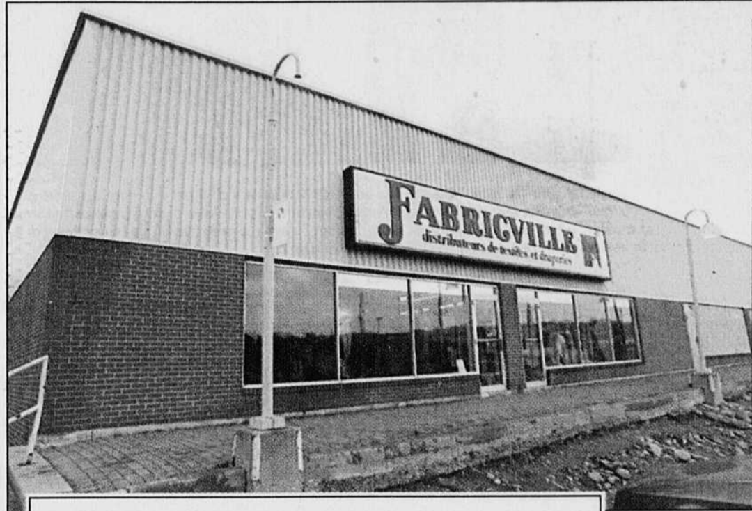
Imacom-Doguerre René Marquis Implantée le long de la rivière St-François depuis 15 ans et symbole de la résistance aux crises printanières, la compagnie Fabricville est contrainte à changer d'adresse en raison de la démolition annoncée des Promenades des Grandes-Fourches. L'entreprise va s'installer à l'étage inférieur de la Place Brouillard.

Les employés d'InterCanadien donneront une conférence de presse aujourd'hui.